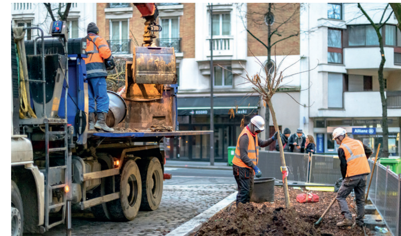
Plantation d'arbres rue Henri Dubouillon