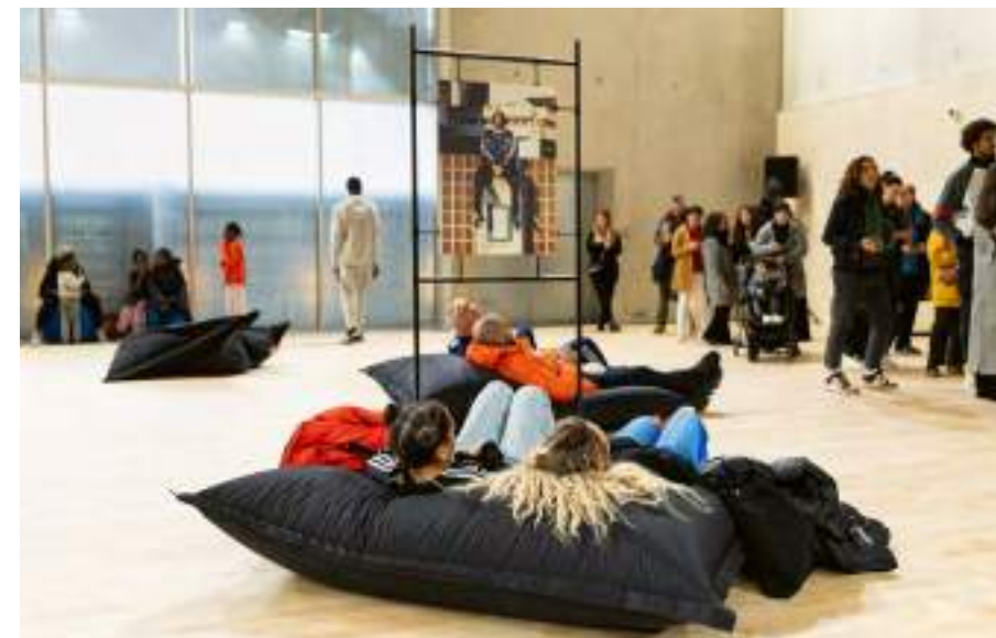
Guillaume Bontemps / Ville de Paris