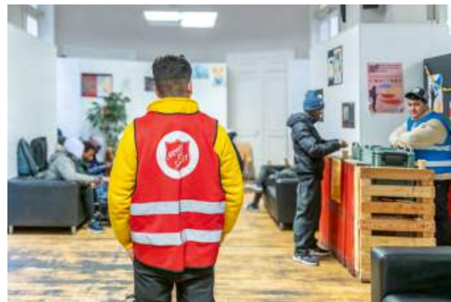
La halte humanitaire est située dans l'ex-mairie du 1 er arrondissement.

La Ville Lumière est aussi une ville refuge. Cet engagement se traduit au quotidien. Un objectif: accompagner les personnes venues y chercher asile.