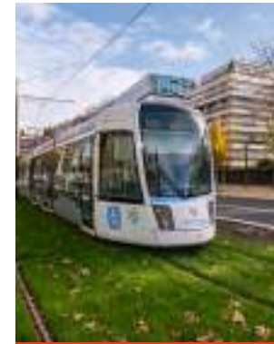
Clément Dorval / Ville de Paris