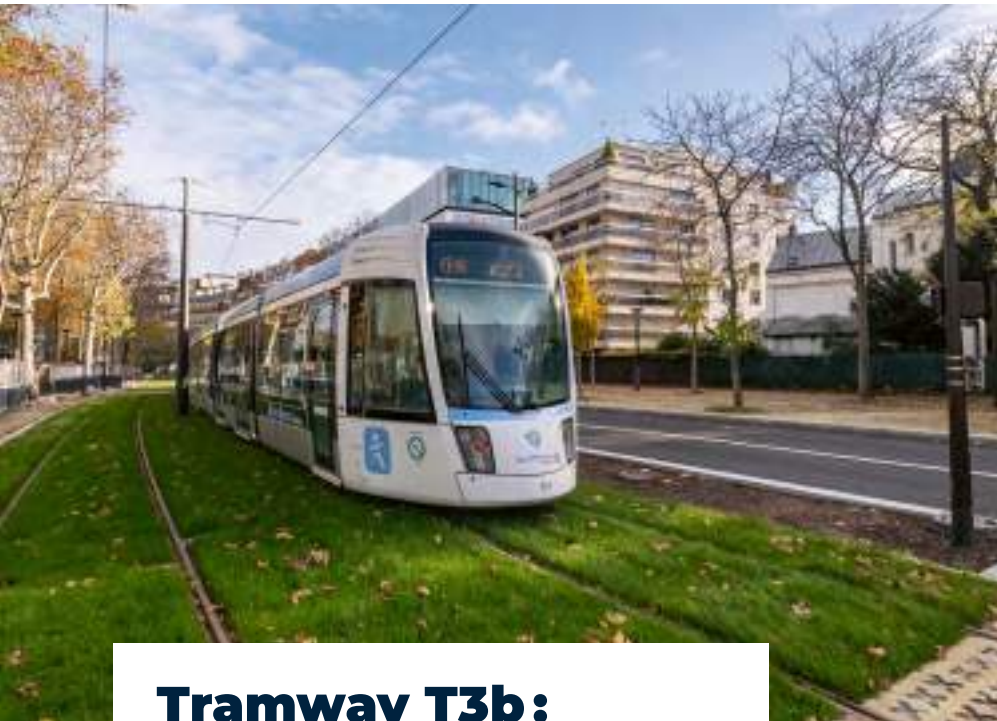
Clement Dorval / Ville de Paris