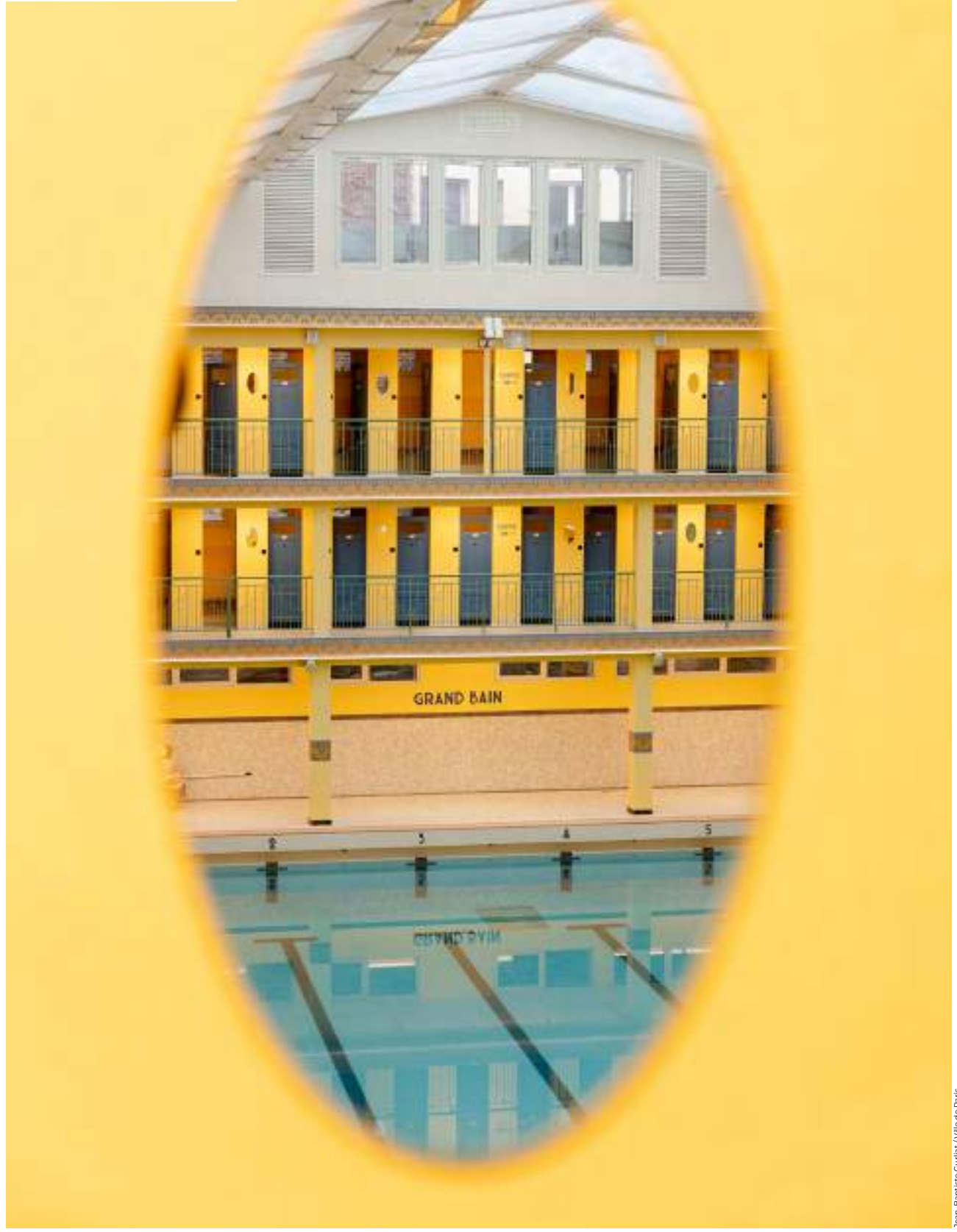
Jean-Baptiste Curliat / Ville de Paris

Après plus de deux ans de travaux de rénovation, qui ont notamment permis d'assurer l'accessibilité aux personnes à mobilité réduite, la piscine Pontoise (5 e ) a rouvert ses portes en décembre dernier. Cet établissement mythique, créé dans les années 1930, possède un bassin de 33 mètres surplombé de coursives d'un habillage jaune et bleu, de cabines privatives et d'une immense verrière. Un bijou d'architecture!