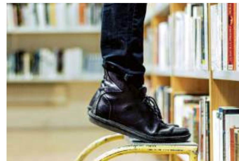
Le 19 e arrondissement accueille sa toute première médiathèque!

La Maison des réfugiés, pilotée par les associations Emmaüs Solidarité