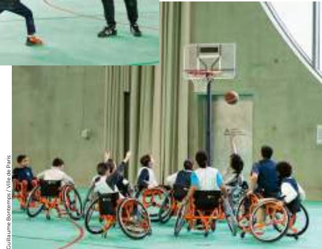
Guillaume Bontemps / Ville de Paris