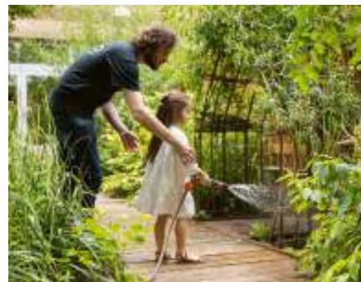
Guillaume Bontemps / Ville de Paris

Plongé au cœur d'une scénographie ludique, interactive et totalement immersive, le visiteur déambule au sein d'un parcours spectaculaire qui met en lumière ce Paris en mutation et tourné entièrement vers le développement de la biodiversité, la préservation du patrimoine ainsi que le renouvellement de l'offre culturelle. Point crucial de cette exposition, la visite nous mène également jusqu'aux abords de la Seine, transformés en un véritable lieu de vie. Un nouveau visage rendu possible grâce à de vastes aménagements tels que la piétonnisation des voies sur berge et l'ouverture à la baignade. Alors, curieux de voir la capitale se réinventer pour l'avenir? ●