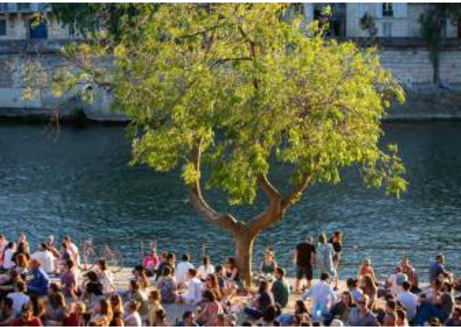
Eliisa Chauveau / Ville de Paris

Cette grande exposition est une occasion joyeuse et ludique de nous redécouvrir en tant que Parisiennes et Parisiens, mais aussi de comprendre l'histoire de notre ville, comme ses transformations récentes au moment où la capitale s'apprête à accueillir les Jeux.