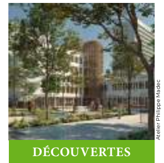
Atelier Philippe Madec