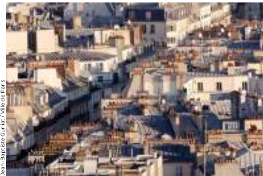
Jean-Baptiste Curliat / Ville de Paris