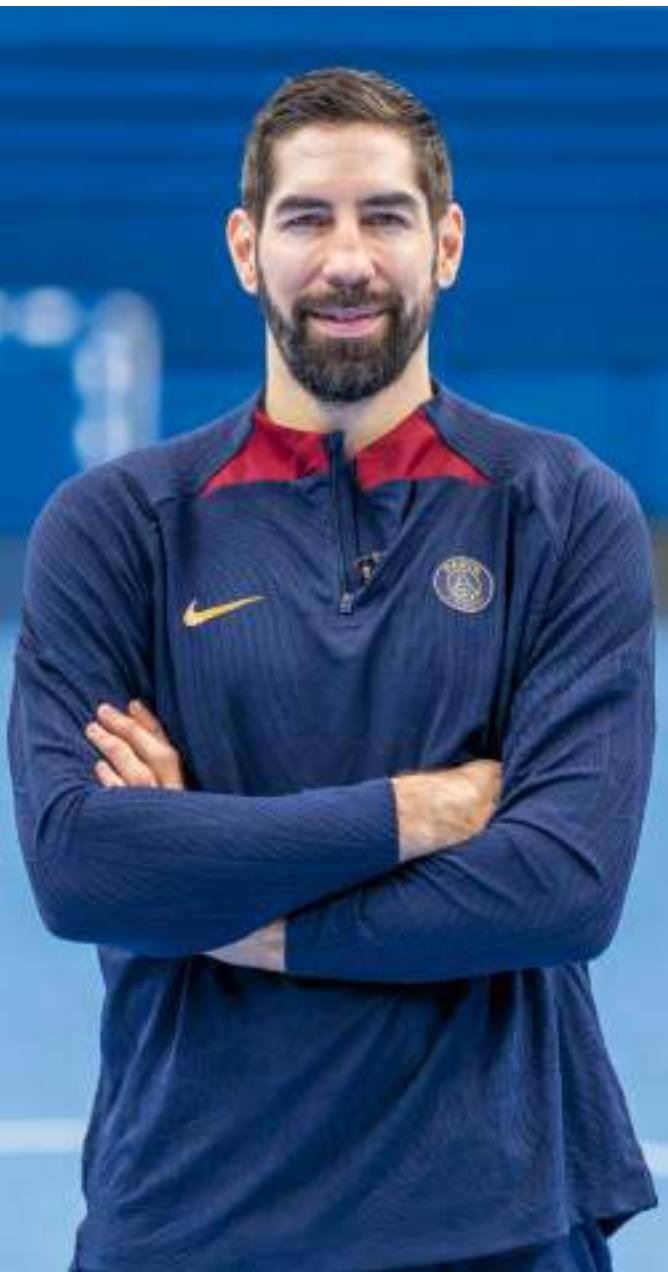
Clément Dorval / Ville de Paris