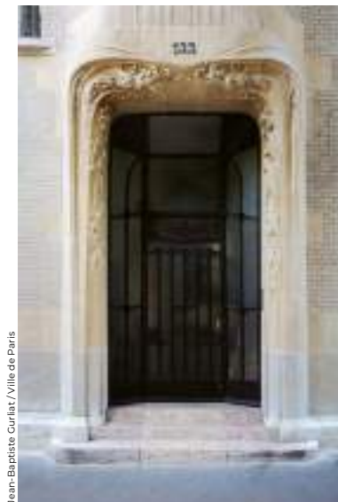
Jean-Baptiste Curliat / Ville de Paris

En mai 1909, Hector Guimard achète un terrain au 122, avenue Mozart (16 e ) et y fait construire un hôtel particulier. Il conçoit lui-même toute la décoration intérieure : lambris, corniches, meubles, serrurerie, lustres et tissus d'ameublement. Les meubles et les boiseries sont exécutés en bois de poirier, dont le grain tendre et lumineux se prête spécifiquement à la traduction des lignes souples et élégantes du graphisme de Guimard. Le premier étage comprend un salon et une salle à manger de forme elliptique. Cette dernière se compose d'un argentier et d'un vaisselier intégrés dans des boiseries, d'une table, de six chaises, de deux chaises à bras et d'un lustre qui ont été restaurés et remontés dans un espace spécialement aménagé au moment de la réouverture du Petit Palais en 2005. ●