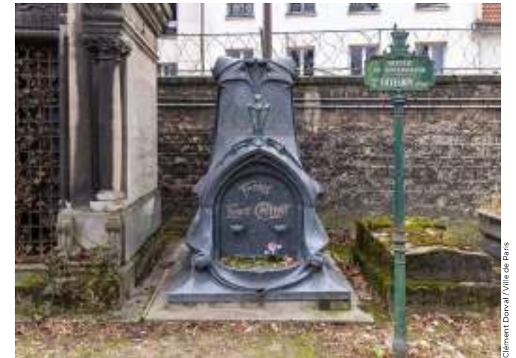
Clément Dorval / Ville de Paris

Guimard aime déstructurer les volumes, faire la part belle aux courbes, contre-courbes et autres excroissances, puisant son inspiration dans le répertoire esthétique végétal. La synagogue de la rue Pavée (Paris Centre) en est un superbe exemple. En complément des plans d'édifices, il compose un catalogue de fontes ornementales pour les balcons, des bancs de jardin, des panneaux de portes, des papiers peints... Il aborde tous les matériaux : le fer, la fonte, le plâtre, le staff, le marbre, le bronze, le bois, la céramique ou le verre. Il imaginera aussi quatorze sépultures ou monuments commémoratifs dont, à Paris, les tombes de Victor Rose au cimetière des Batignolles (17 e ), d'Albert Adès et des familles Giron, Mirel et Gaillard à Montparnasse (14 e ), de Deron-Levent au cimetière d'Auteuil (16 e ) et d'Ernest Caillat au Père-Lachaise (20 e , photo ci-contre). ●