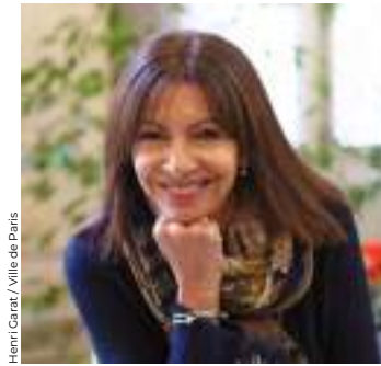
Henri Caratz / Ville de Paris

Après plus de deux ans de travaux de rénovation, qui ont notamment permis d'assurer l'accessibilité aux personnes à mobilité réduite, la piscine Pontoise (5 e ) a rouvert ses portes en décembre dernier. Cet établissement mythique, créé dans les années 1930, possède un bassin de 33 mètres surplombé de coursives d'un habillage jaune et bleu, de cabines privatives et d'une immense verrière. Un bijou d'architecture!