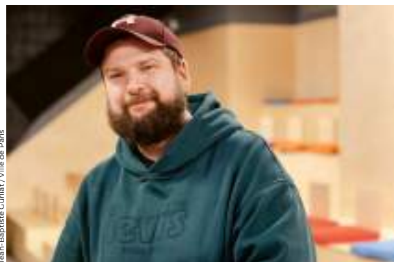
Jean-Baptiste Guiffart / Ville de Paris

Le tramway T3b est enfin prolongé vers l'ouest entre la porte d'Asnières (17 e ) et la porte Dauphine (16 e ) ! Un trajet de 3,2 kilomètres qui ne vous prendra que quinze minutes ! Sept nouvelles stations jalonnent le parcours, avec des correspondances sur les lignes 1, 2 et 3 du métro, les lignes C et E du RER, et de nombreuses lignes de bus. Concernant l'accessibilité, les rames et les stations ont été conçues pour remédier à toutes les difficultés d'accès. Cette extension a aussi permis un vaste aménagement urbain avec plus d'espace aux piétons et aux cyclistes. Et côté végétalisation ? Près de 14 000 m 2 de gazon ont été posés sur la plateforme du tramway et 250 arbres plantés le long du parcours !