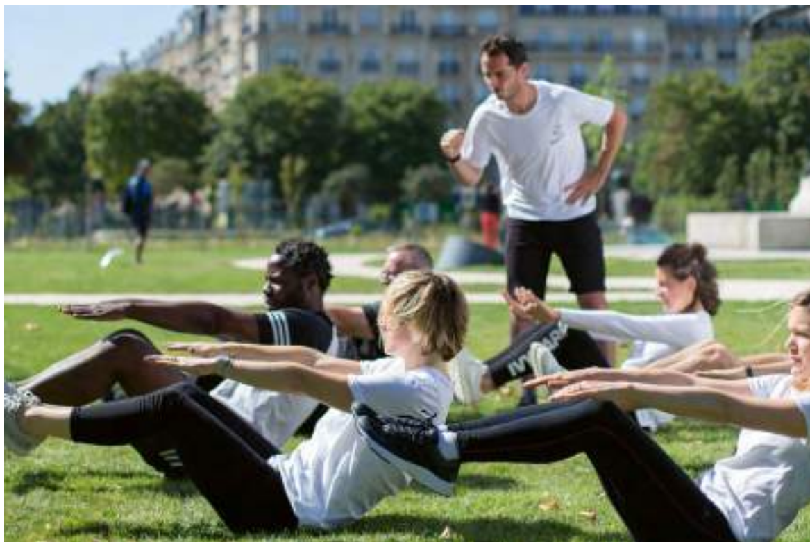
Soleil et place de la Nation: le bon mix pour travailler ses abdos avec Paris Sport Dimanches!

C'est un autre héritage : profitant de la dynamique des Jeux, Paris a créé une offre de sport gratuite et adaptée à tous les publics.