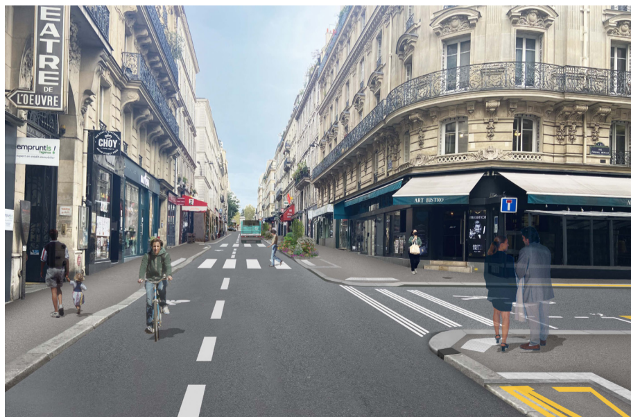
Photomontage de l'aménagement