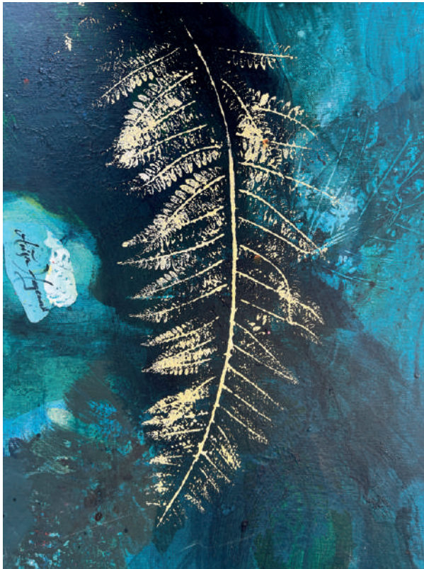
Acrylique, encre de Chine - Une lumière dans la nuit