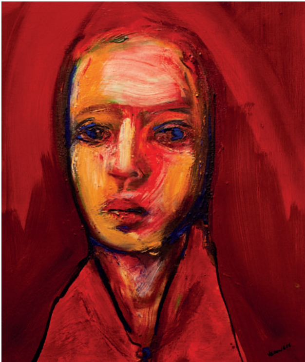
Huile sur toile - La fille en rouge