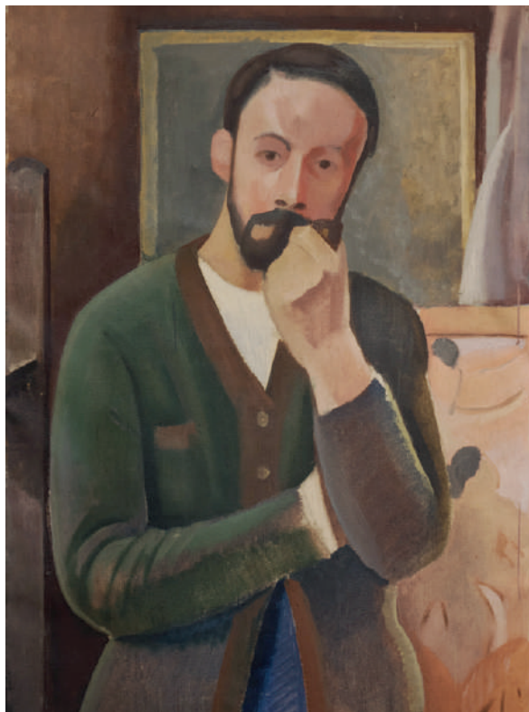
Huile sur toile - Autoportrait à la pipe © Olivier Esmein