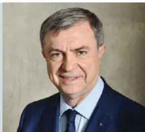
Jean-Pierre Lecoq Maire du 6 e arrondissement Conseiller régional d'Île-de-France