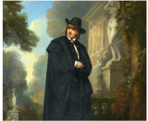
© Portrait de James Pradier par Marius Fouque, Musée d'art et d'histoire de Genève

James Pradier, pseudonyme de Jean-Jacques Pradier, né à Genève apprenti graveur, s'installe à Paris rue Jacob en 1807. Il entre dans l'atelier de sculpture de François Lemot à l'École des Beaux-Arts et obtient le premier prix de Rome, termine sa formation à l'Académie de