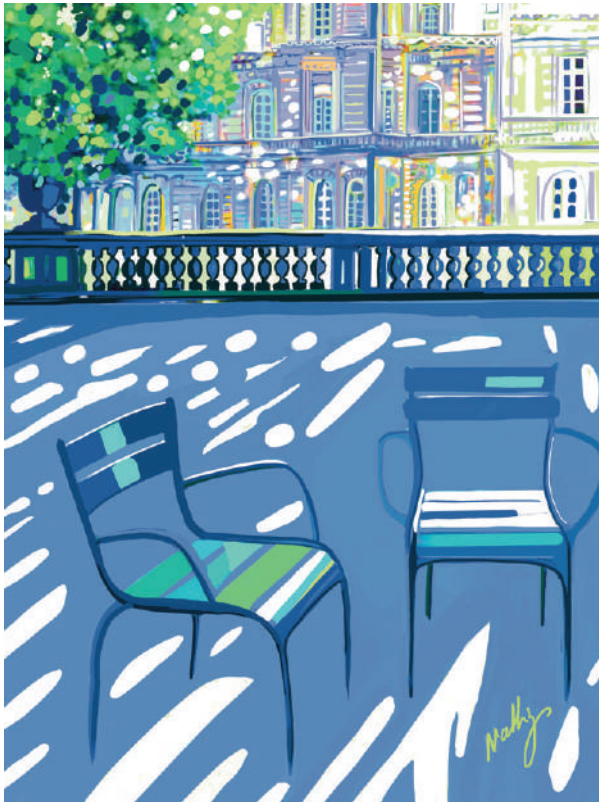
Mixed média sur dibond - les chaises du Luxembourg

Pour nous, elle a créé une collection unique, où le jardin du Luxembourg est à honneur.