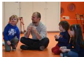
Conseil de Quartier de Paris Centre - Marais Archives

N'hésitez pas à apporter l'indispensable dont votre enfant aurait besoin : doudous, casque antibruit, jouet antistress... Les animateurs ne seront pas habilités à administrer un traitement médical.