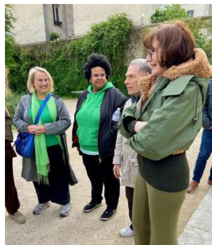
Conseil de Quartier Marais-Archives