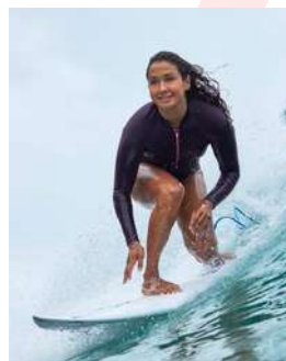
Vahiné Fierro Surf