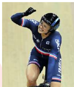
Mathilde Gros Cyclisme sur piste