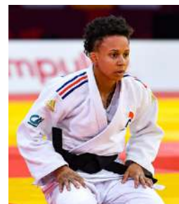
Amandine Buchard Judo