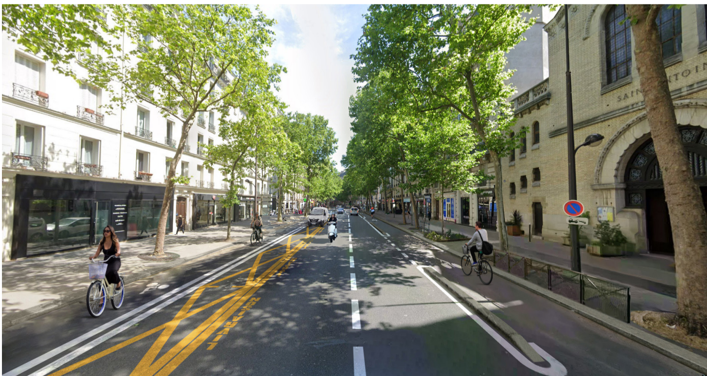
Photomontage | Crédits @atelier nous