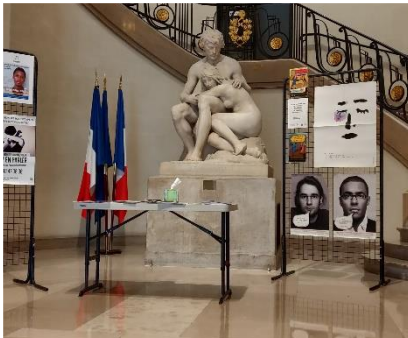
Stand d'information à la Mairie du 5e