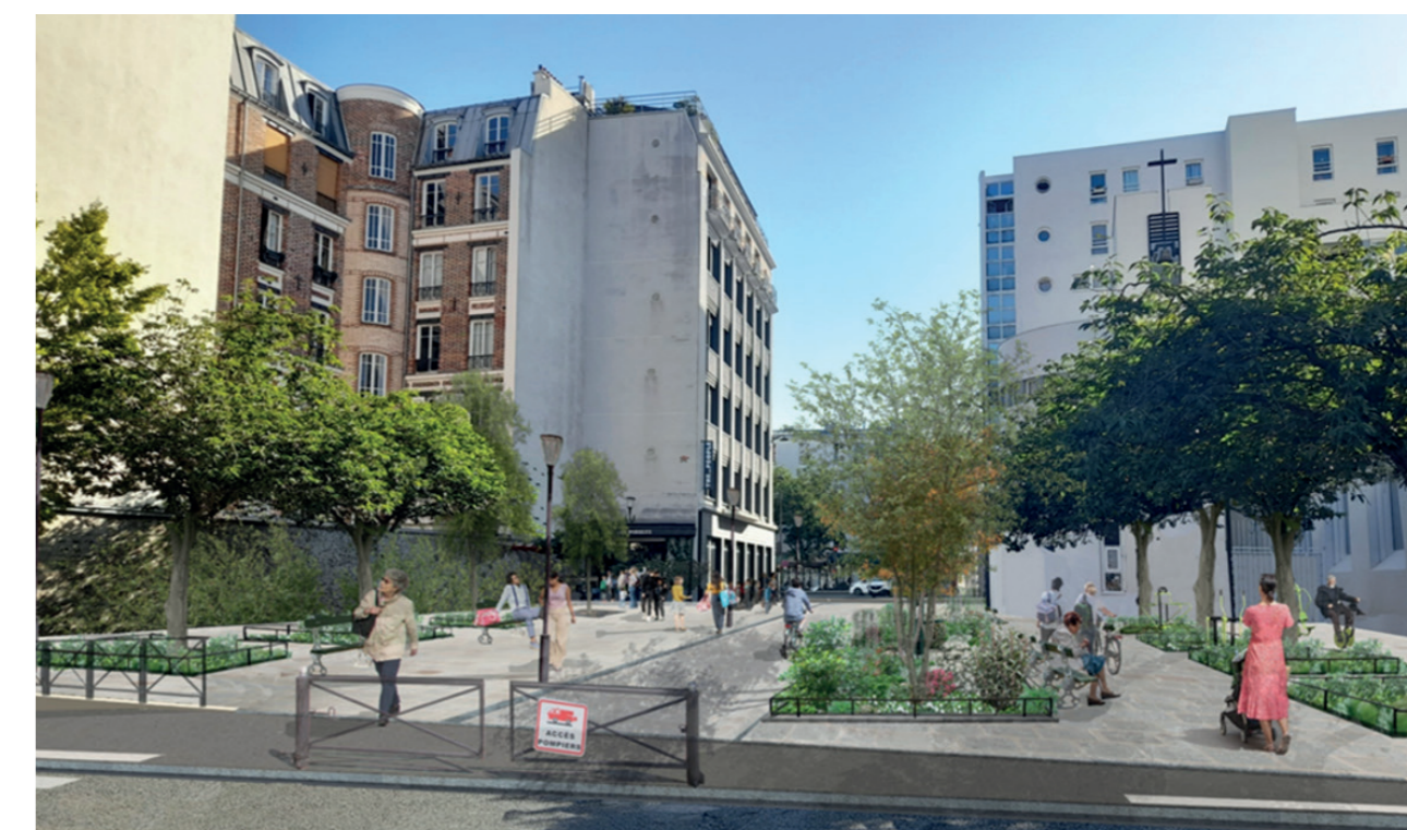
Photomontage de l'aménagement de la Place Marek Edelman