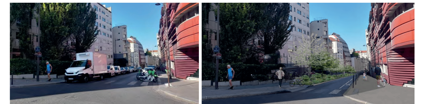
Photomontage de l'aménagement de la rue de la Fontaine-au-Roi, entre les rues de Vaucouleurs et du Moulin-Joly

La Mairie souhaite dans un premier temps réaliser les aménagements prévus qui impliquent des modifications du plan de circulation (rue de la Fontaine-au-Roi). Les études du plan de circulation se poursuivent pour définir un projet cohérent à l'échelle de l'arrondissement et de la Ville.