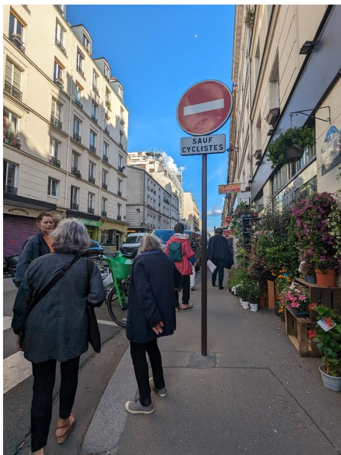
Signalisation rue Saint-Maur