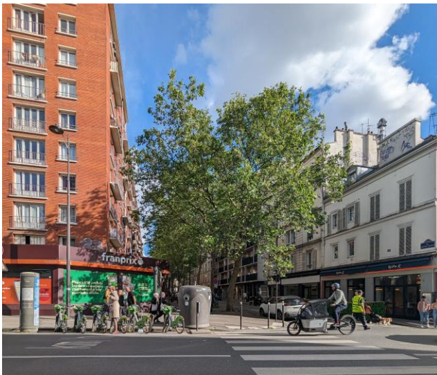
Trottoirs encombrés rue de la Roquette