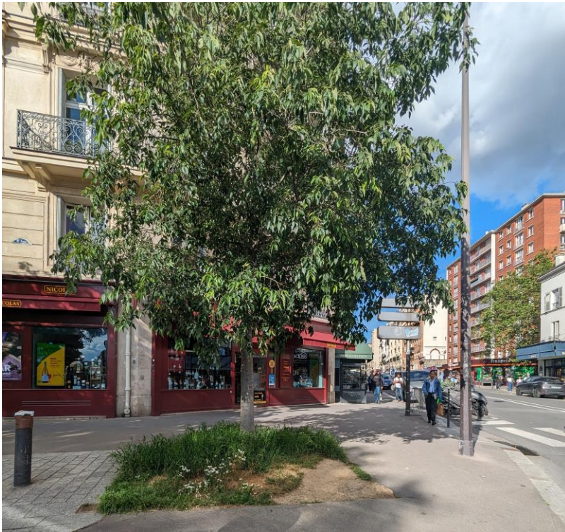
pied d'arbre angle rue de la Roquette place Léon Blum