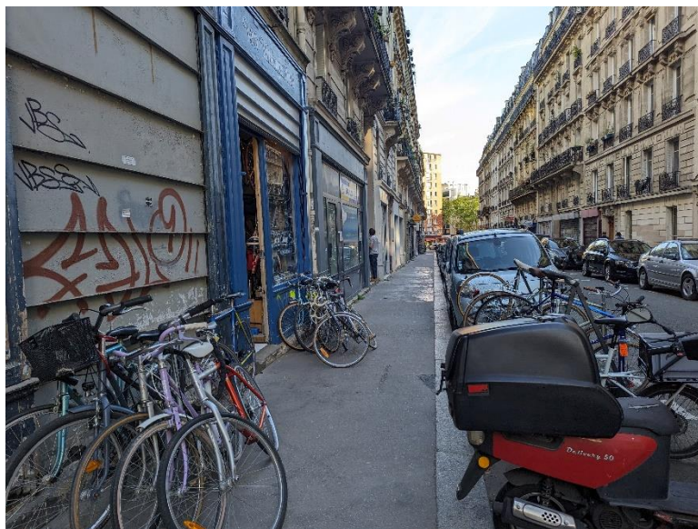
Encombrement des trottoirs rue Pache