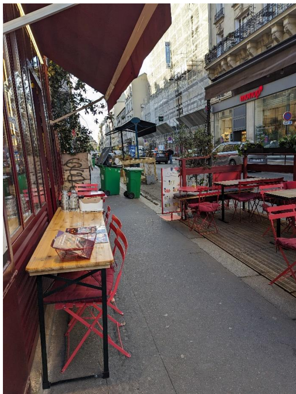
Encombrement des trottoirs rue Saint-Maur