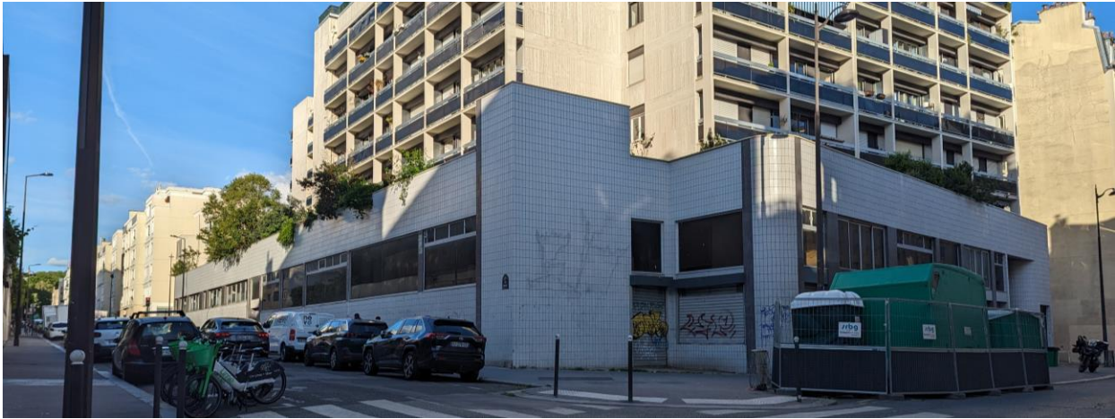
Dégagement à aménager rue Saint-Maur