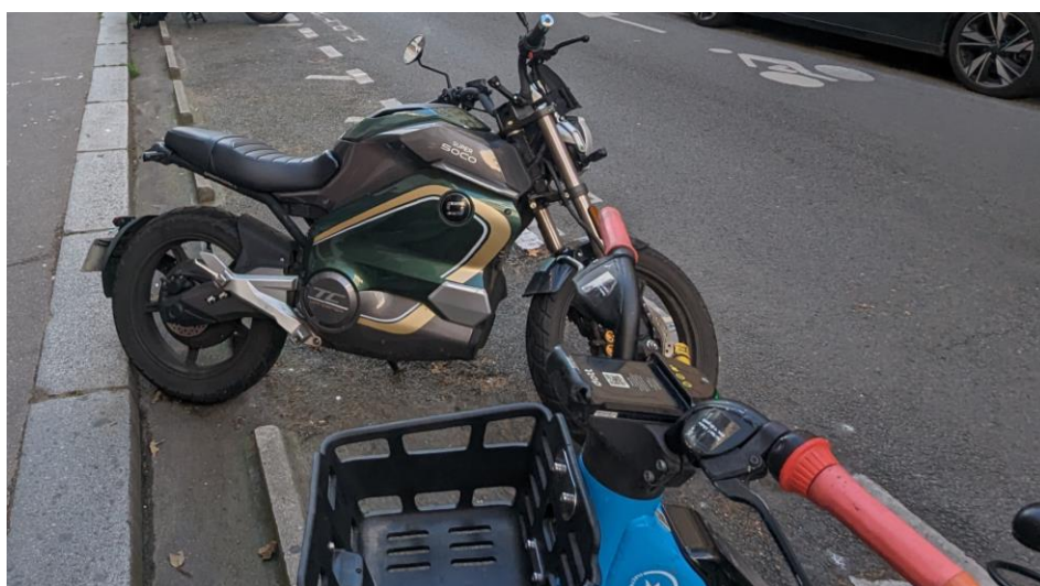
Rebords empêchant le dépassement des motos sur le trottoir