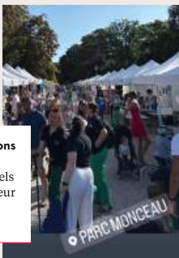
Le traditionnel Forum des associations s'est tenu pour la 2 e édition au Parc Monceau, avec les partenaires culturels et associatifs. Une journée où la chaleur était aussi forte que l'affluence. À l'année prochaine !