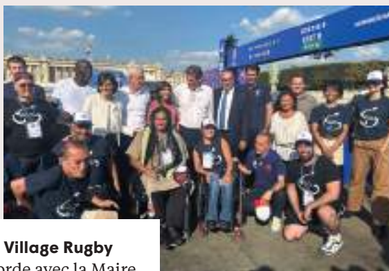
Inauguration du Village Rugby Place de la Concorde avec la Maire de Paris, son adjoint au Sport et la Ministre des Sports, en présence du Préfet de Police de Paris.