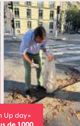
L'opération « World Clean Up day » a permis de collecter plus de 1000 tonnes de déchets . Dans notre arrondissement, les participants ont été informés sur le tri citoyen avant de nettoyer en équipes les abords du parc Monceau.