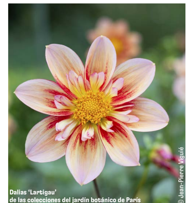
Dalias 'Lartigau' de las colecciones del jardín botánico de París