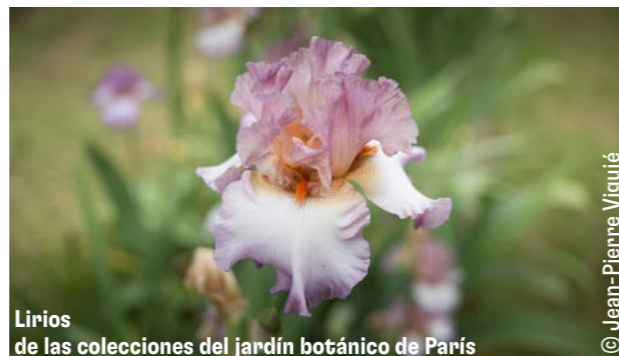
Lirios de las colecciones del jardín botánico de París