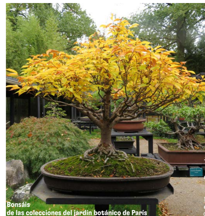
Bonsáis de las colecciones del jardín botánico de París