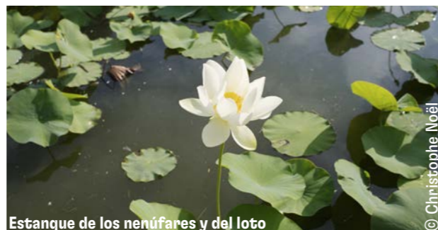
Estanque de los nenúfares y del loto

El parque cuenta con la etiqueta "Jardin Remarquable" (Jardín Notable) otorgada por el Ministerio de Cultura francés. Con una superficie de casi 30 hectáreas, el lugar está dedicado a la educación ambiental y la observación de plantas, así como al ocio, con el espacio de conciertos Delta, actividades para familias y áreas de juegos, entre jardines y naturaleza.