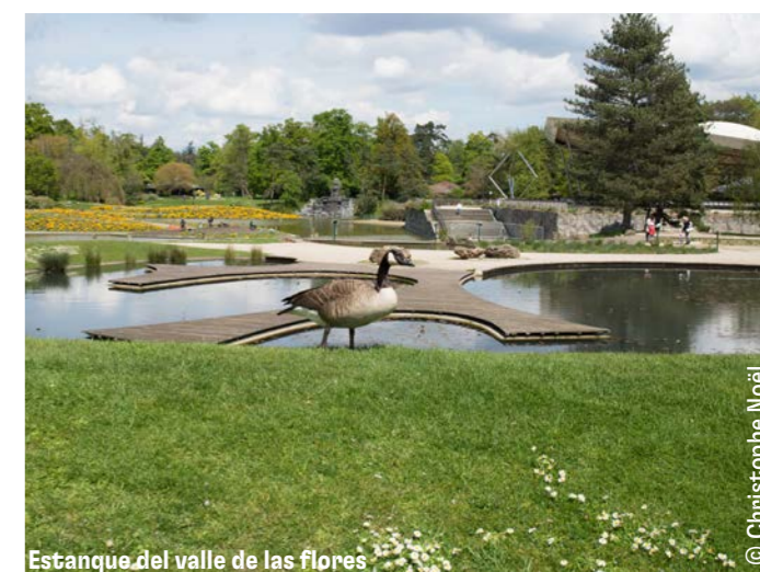
Estanque del valle de las flores

Para iniciar a los jóvenes naturalistas.