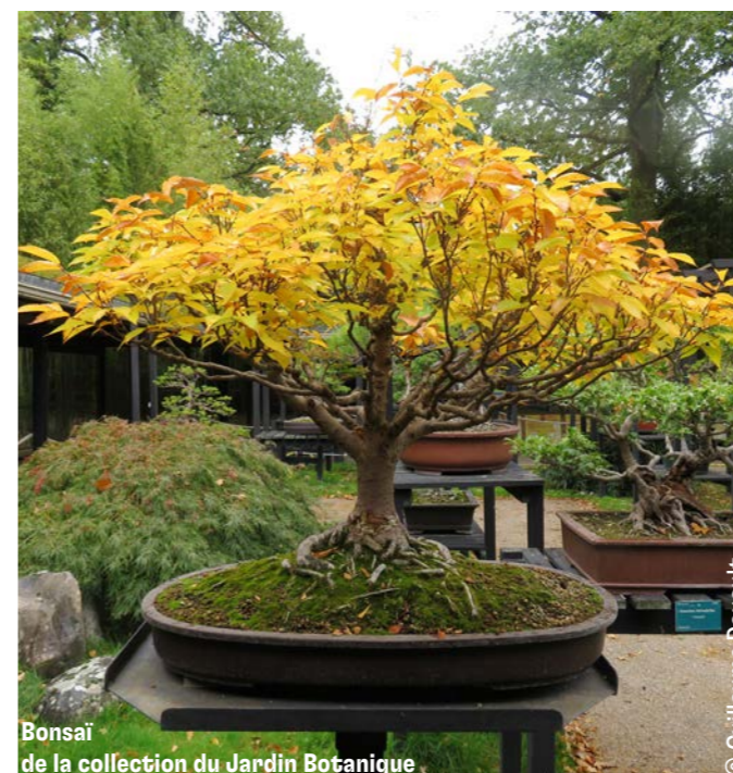
Bonsai de la collection du Jardin Botanique

Sans titre - Maria Simon, 1972 Entre la Bibliothèque nature et le miroir d'eau