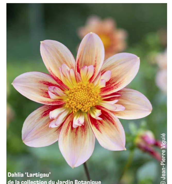
Dahlia 'Lartigau' de la collection du Jardin Botanique