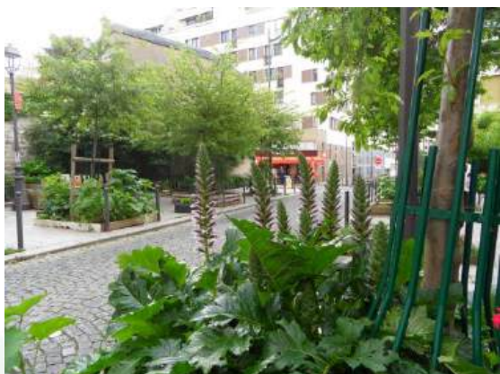
Rue de Buzenval - permis de végétaliser