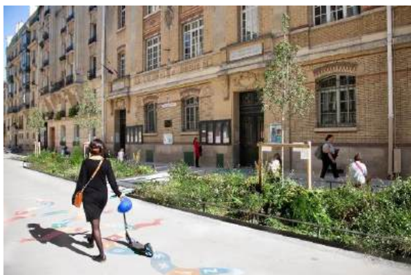
Rue aux écoles dans la rue de l'Arbalète