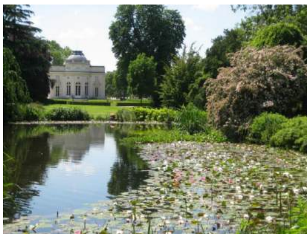
© Jean-Christophe Lucas / Ville de Paris

En bordure du bois de Boulogne, ce parc paysager de 24 hectares de verdure (un des 4 sites du jardin botanique de Paris) présente une belle diversité d'arbres, d'arbustes, des collections horticoles comme les iris, les pivoines et surtout la prestigieuse roseraie. Une visite dans le temps pour évoquer l'histoire du lieu, du XIX e siècle jusqu'à nos jours, ses propriétaires successifs et ses paysagistes qui ont fait du jardin ce qu'il est aujourd'hui.