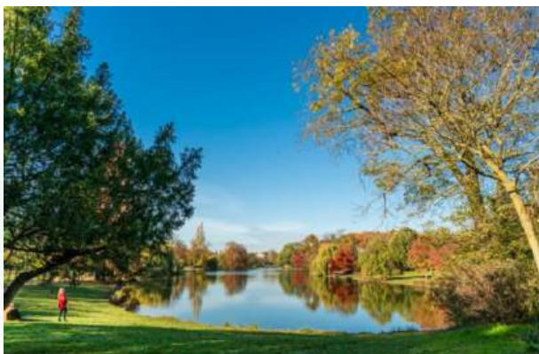
© Sonia Yassa / Ville de Paris – Lac Daumesnil