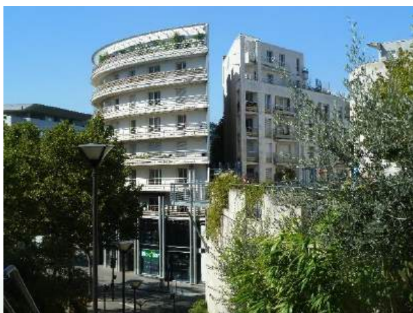
© Ville de Paris – Végétalisation participative Léon Séché