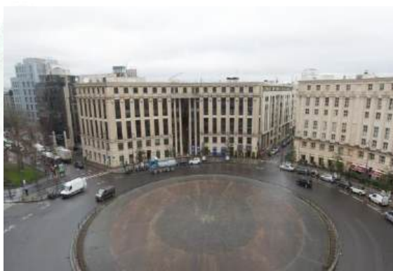
© Ville de Paris – Place de Catalogne avant travaux