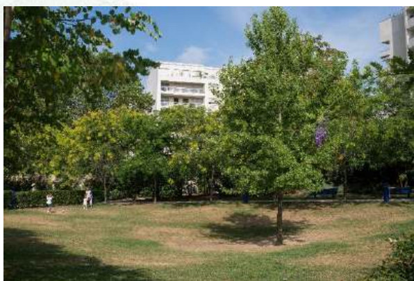
© Antoine Polez / Ville de Paris - Jardin Solange Faladé