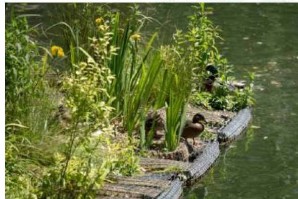
Radeau végétalisé sur le Canal Saint-Martin