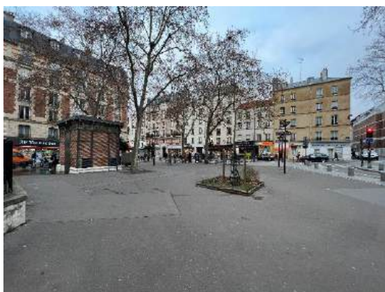
Place S. Monod avant travaux