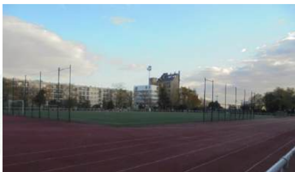
© Ville de Paris – Avant travaux