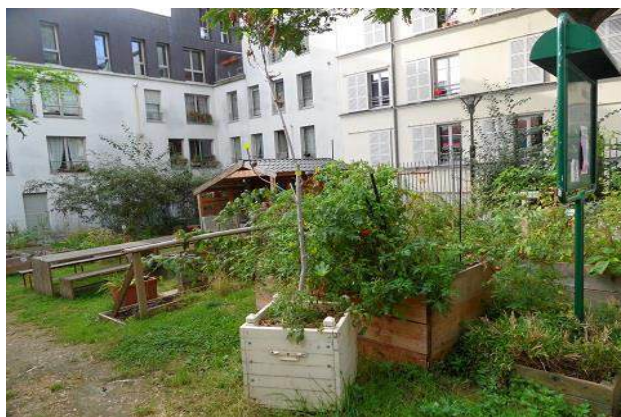
Jardin partagé « jardin des délices »

Les actions citoyennes permettent de renforcer les cheminements verts dans la ville et les corridors écologiques pour la faune parisienne. Les habitants peuvent s'investir dans des jardins partagés, dans la rue ou sur le trottoir grâce au permis de végétaliser, ou encore végétaliser leur balcon, les murs... Les associations de jardins partagés accompagnés par la Ville ont adhéré aux principes de la « Charte