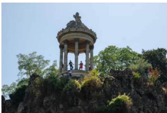
© Thierry Guillaume / Ville de Paris – Parc des Buttes-Chaumont