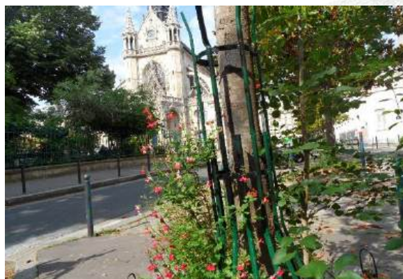
Plantations de fleurs par une association de riverains en pied d'arbres

Au détour de l'église Saint Bernard, de l'Institut des Cultures d'Islam, de la Villa Poissonnière, des anciens lavoirs transformés en théâtre ou en habitations et de l'ancien site du cimetière Marcadet, la biodiversité a retrouvé une véritable place dans ce quartier populaire. Les habitants et associations locales s'investissent dans les jardins partagés la Goutte verte et l'Univert et dans de nombreux permis de végétaliser qui ont transformé le paysage urbain, aux côtés de la rue Saint-Luc devenue rue aux écoles végétalisée et apaisée.