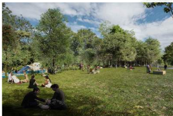
© Ville de Paris - Préfiguration de la prairie

La Ville de Paris a acquis une partie des abords de la Petite Ceinture du 20 e entre la rue du Volga et le cours de Vincennes pour réaliser un nouveau parc de 3,5 hectares. Les travaux ont débuté en 2023 pour une ouverture au public en juillet 2024. Les nouveaux aménagements le long de la voie ferrée vont permettre de favoriser la préservation et le développement de la biodiversité par la plantation de plus de 2000 arbres, de 6000 jeunes plants forestiers, 122 arbres tiges et 21 baliveaux. Les essences végétales sauvages ont été collectées en amont des travaux pour être ressemées dans le nouveau site et favoriser ainsi le développement d'une biodiversité locale.