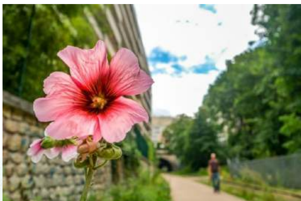
© Clément Dorval / Ville de Paris – Petite Ceinture du 15 e