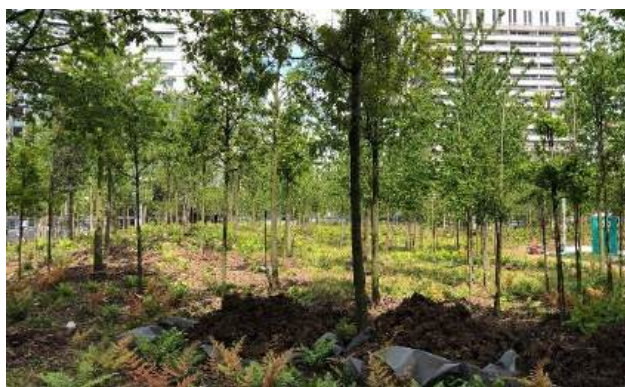
© Ville de Paris - Place de Catalogne après travaux

Les orientations du Plan Climat de Paris se déclinent concrètement par la création de 300 îlots de fraîcheur partout dans la capitale d'ici 2030, dont des forêts urbaines. Après une concertation qui s'est tenue fin 2021 puis des travaux de préfiguration en 2022, la forêt urbaine de la place de Catalogne sort de terre en 2024. Espace très minéral dédié à la circulation automobile, la place constituait un îlot de chaleur important en été et rompait la coulée verte qui borde le secteur Maine Montparnasse.