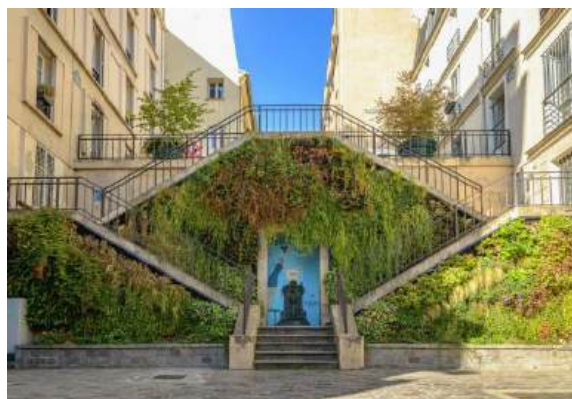
Mur végétalisé rue Rollin

Faire de Paris une ville résiliente face aux enjeux climatiques et de préservation de la biodiversité nécessite de nombreux aménagements. La végétalisation des rues répond à ces enjeux en permettant notamment d'offrir des îlots de fraîcheur urbains, en facilitant la gestion des eaux de ruissellement tout en améliorant notre cadre de vie. Ce parcours met en lumière des aménagements de la Ville et des initiatives citoyennes pour favoriser le développement du végétal en milieu urbain, à travers, entre autres, le débitumage, les rues aux écoles et les permis de végétaliser.