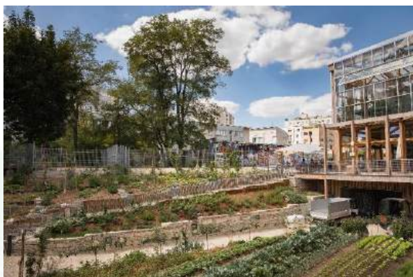
© Guillaume Bontemps / Ville de Paris – Ferme du Rail