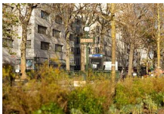
Végétalisation de la rue de la Chapelle

Livré en 2020, ce nouveau parc permet d'augmenter la surface en espace vert de ce quartier de 28 841 m 2 . Un jeu de perspectives, d'allées courbes et de pentes douces confère à ce parc sobriété et naturel. Une palette végétale essentiellement locale, formant prairies, vergers ou jardins, favorise la biodiversité. Outre son auvent, vestige de son passé ferroviaire, le parc offre une diversité d'usages,