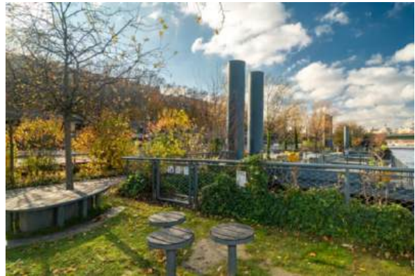
Jardin sur barges

Le fleuve est un corridor écologique d'intérêt national, mais également un atout économique important pour le développement de la métropole. Jusqu'au port du Gros Cailloux, les piétons ont remplacé les voitures sur les voies sur berge. Créant un véritable parc sur la Seine, 5 barges amarrées ont été végétalisées de plantes indigènes et constituent un habitat accueillant pour les espèces animales notamment aquatiques grâce à des frayères et des plages aménagées.