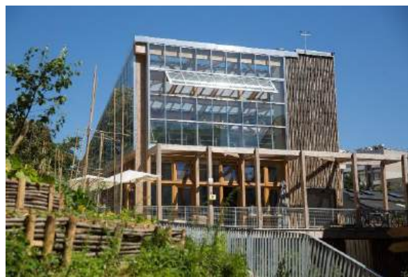
Serre de la Ferme du Rail