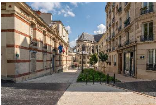
© Sonia Yassa / Ville de Paris – « Rue aux écoles » de la rue Saint-Luc