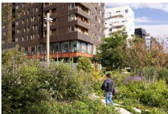
Promenade Lévi Strauss