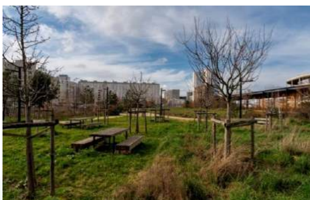
© Sonia Yassa / Ville de Paris – Verger du parc Chapelle Charbon