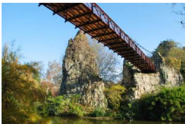
© Thierry Guillaume / Ville de Paris – Parc des Buttes-Chaumont