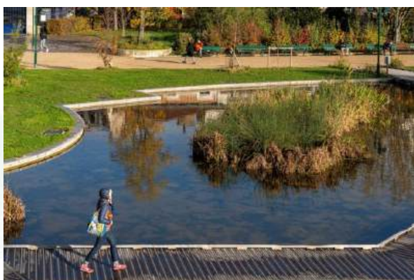
© Sonia Yassa / Ville de Paris – Bassin végétal