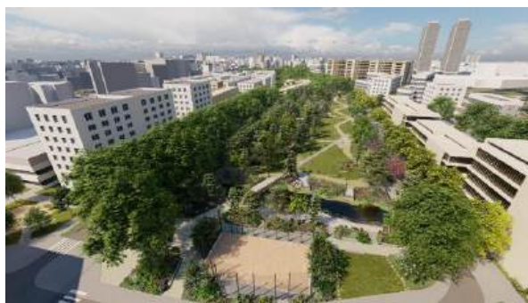
© Ville de Paris – Après travaux (préfiguration)

La première phase du parc, entre la rue Serpollet et la nouvelle traverse, ouvre aux habitants en juillet 2024. 109 arbres ont été plantés à l'hiver dans cette première tranche du parc (1,3 ha) et 110 arbres dans les rues de ce quartier populaire et résidentiel de l'est parisien. Ce nouveau parc, co-construit dans des démarches de concertation avec les habitants, offre de nouveaux espaces de fraîcheur et de détente : une grande pelouse, une aire de jeux pour enfants, des tables de ping-pong, et un vaste bassin de 900 m 2 , alimenté par les eaux de pluie.