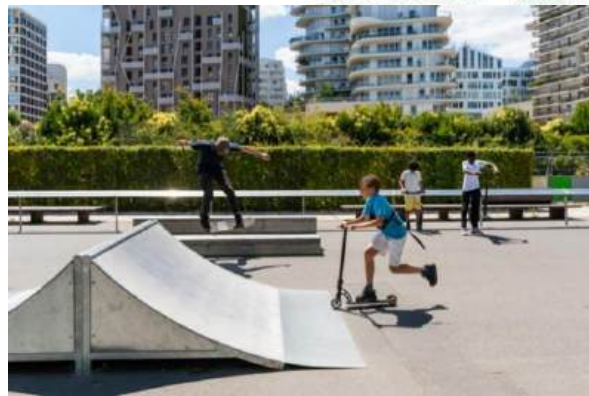
Skate park

Ce vaste parc s'inscrit dans les aménagements des 54 hectares de la ZAC (Zone d'Aménagement Concerté) Clichy-Batignolles, à l'emplacement de l'ancienne gare de marchandises. Le parc de 10 hectares est un trait d'union entre les quartiers alentours et le nouveau quartier intégrant immeubles de Haute Qualité Environnementale, géothermie, panneaux solaires et bâtiments végétalisés. Conçu autour des saisons, du sport et de l'eau, le parc a été aménagé pour répondre aux besoins de tous les usagers, faune et flore locales comprises.