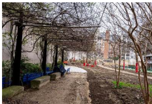
Extension Jardin Solange Faladé

Le Jardin Solange Faladé, situé dans le quartier Bel Air Nord, fait aujourd'hui 4 500m 2 . Un projet d'aménagement co-porté avec la RATP permet d'étendre le jardin existant de 2 500m 2 . Convivial et accueillant ce jardin gomme les contraintes initiales d'un site très enclavé et d'un immeuble à la verticalité imposante. L'allée sinueuse ponctuée de féviers d'Amérique traverse le jardin guidant les promeneurs jusqu'à la grande pelouse centrale. Le long du mur de l'école Marsoulas, un jardin pédagogique est réservé aux enfants des écoles riveraines pour sensibiliser les plus jeunes à la découverte des saisons, ainsi que de la faune et flore locale.