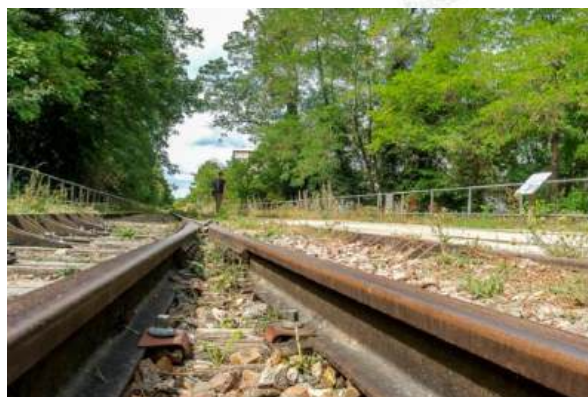
Petite Ceinture du 15 e

Véritable corridor écologique de Paris, la Petite Ceinture du 15 e arrondissement participe à la préservation de nombreuses espèces animales et végétales. Prairies, fourrés, bosquets ponctués de clairières et de zones humides jalonnent ce jardin aménagé sur une portion de la ligne de chemin de fer désaffectée. Son rôle est déterminant car il relie le jardin Georges Brassens au parc André Citroën créant ainsi une percée végétale dans cette zone urbanisée.