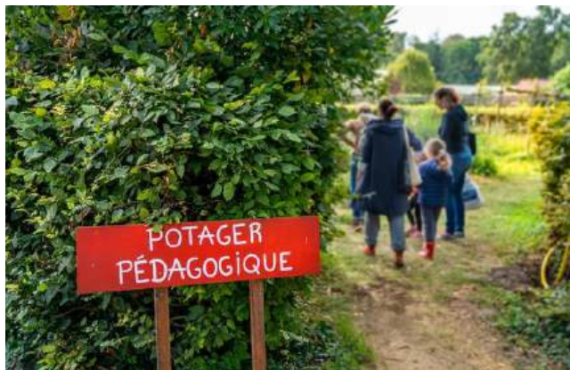
© Clément Dorval / Ville de Paris – Potager pédagogique de la Ferme de Paris

La visite présente les productions agricoles locales de la Ferme de Paris et leurs enjeux. Vous découvrirez les productions végétales réalisées en pleine terre avec des techniques visant à préserver les sols (couverts végétaux, rotations des cultures, etc.). Le choix des espèces sera également traité avec notamment l'introduction de plantes alimentaires peu courantes. Enfin vous observerez une grande diversité de cultures : céréales, fruits, légumes, plantes condimentaires, plantes oléagineuses, etc.