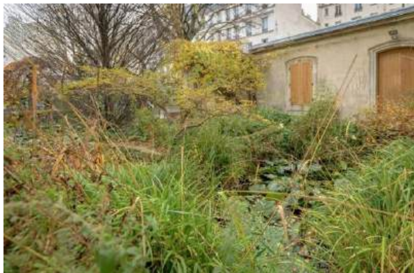
Zone végétalisée dans le Jardin Villemin - Mahsa Jîna Amini