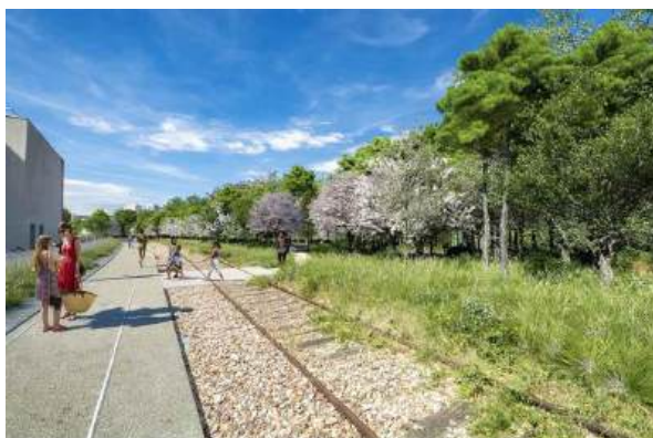
Préfiguration du sentier ferroviaire en lisière du Bois