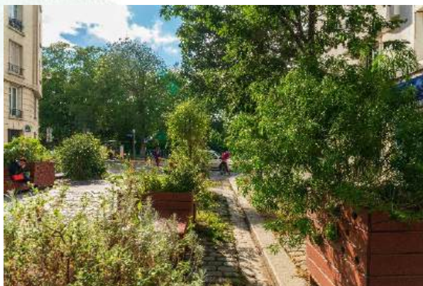
Végétalisation participative rue Léon Séché