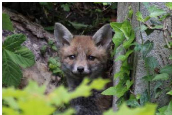
Renard roux

Site historique et touristique très fréquenté, la nécropole la plus connue de France constitue aussi un véritable réservoir de biodiversité de plus de 40 hectares où cohabitent plus de 140 espèces animales sauvages (dont le renard roux de retour depuis 2020 !). Le cimetière n'est pas éclairé la nuit pour favoriser leur implantation. Depuis 2015, les cimetières parisiens sont tous entretenus sans produits phytosanitaires pour préserver la santé des agents et des visiteurs, réduire la pollution des sols, de l'eau et de l'air, et favoriser la biodiversité.