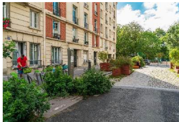
Végétalisation participative rue Léon Séché

La rue Léon Séché est un exemple emblématique de rue verte, créant une continuité végétale grâce aux permis de végétaliser entretenus par les riverains jusqu'au square Jean Chérioux, puis jusqu'au square Saint-Lambert. Dans les rues-jardin, la circulation automobile est absente ou apaisée, afin de donner la priorité aux piétons et aux mobilités douces. Dans chaque arrondissement, les rues-jardin sont imaginées et réalisées en lien étroit avec les habitants : la concertation préalable est indispensable, mais la participation des habitants continue au-delà. Leur implication tout au long du projet est essentielle puisque que ce seront les riverains qui feront vivre la rue-jardin, en lien avec les services de la Ville.