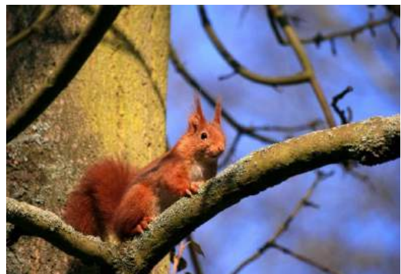
Ecureuil Roux