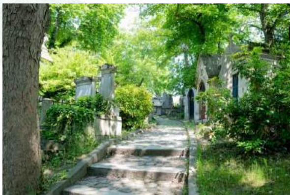
© Romain Duflos / Ville de Paris – Cimetière du Père Lachaise