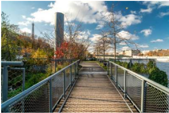
Archipel des Berges de Seine Niki de Saint-Phalle