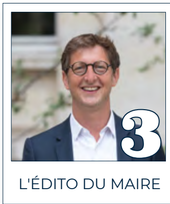
L'ÉDITO DU MAIRE