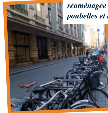
Rue de la Verrerie

Après des premiers travaux en 2019 qui ont créé un espace de circulation unique avec des trottoirs et une chaussée de plain-pied entre la rue de Moussy et du Bourg-Tibourg, la rue de la Verrerie continue sa mutation. De mars à juillet 2021, la portion située entre la rue du Renard et la rue de Moussy sera réaménagée selon le même principe et verra arriver, en outre, des assises, des poubelles et des espaces de stationnement pour les vélos.