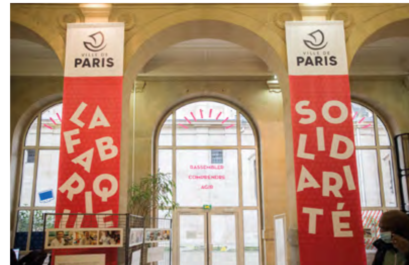
La Fabrique de la Solidarité

Dans les mairies et les bâtiments publics libérés, place à la solidarité