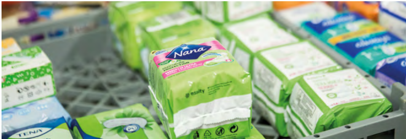
Collecte de protections hygiéniques