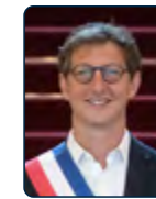
Ariel WEIL Maire de Paris Centre