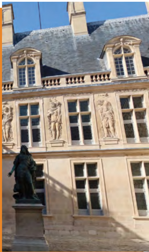
Le musée Carnavalet

Après 4 années de travaux, le plus ancien musée de Paris va bientôt rouvrir ses portes. La fin du chantier a été, pour la Mairie de Paris Centre, l'occasion de rééquilibrer l'espace de stationnement des rues Payenne et de Sévigné. Un nouvel aménagement élargit le trottoir de la rue Payenne pour faciliter la mobilité des piétons. Plus de 100 places de stationnement vélos sont créées, et des zones de livraisons sont matérialisées. 5 places de stationnement payants ont été conservées, ainsi que quelques places pour les motos. Toutes les mobilités peuvent ainsi cohabiter de manière plus équilibrée.