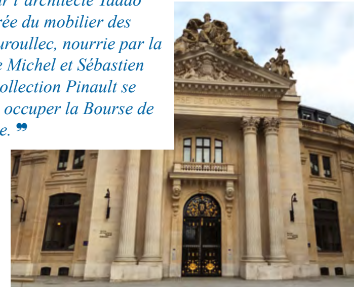
La Bourse de Commerce

conçus par l'architecte Tadao Ando, parée du mobilier des frères Bouroullec, nourrie par la cuisine de Michel et Sébastien Bras, la collection Pinault se prépare à occuper la Bourse de Commerce.