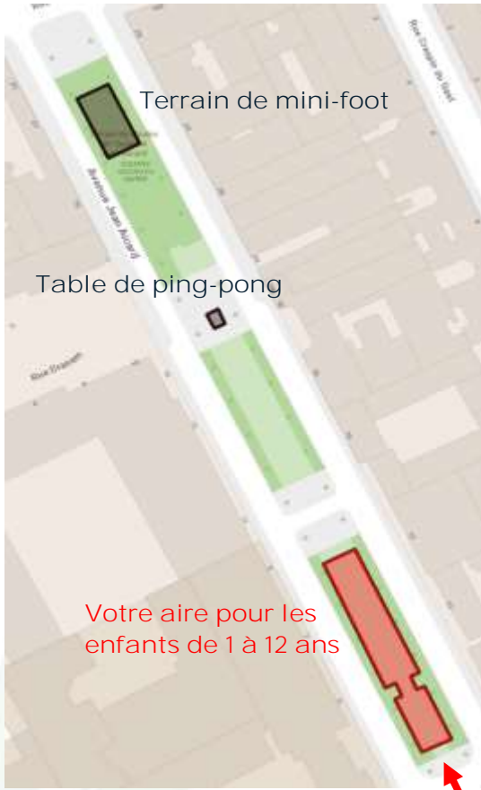
Plan de localisation au sein du jardin