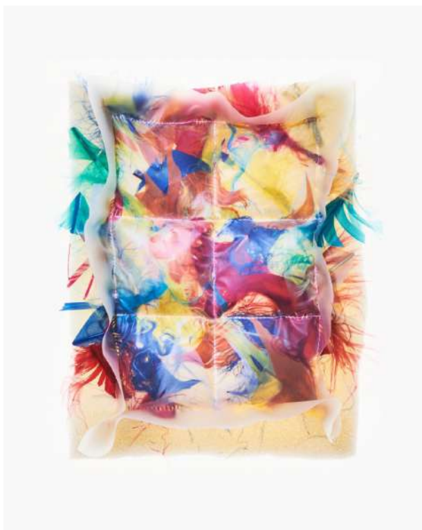
Figure Libre Stéphane Ashpool

La Galerie du 19M invite le créateur Stéphane Ashpool à une carte blanche, à la croisée de son univers créatif et des savoir-faire des Métiers d'art.