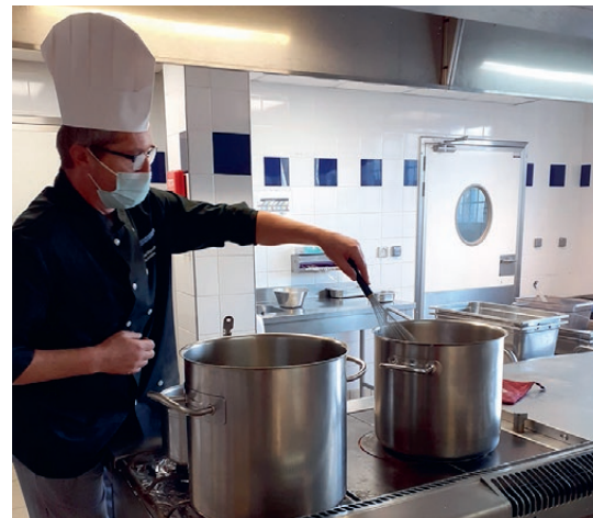
Des repas préparés sur place