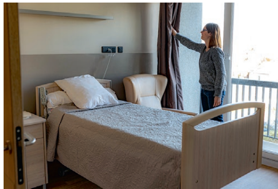
Des chambres rénovées

Vous avez la possibilité d'apporter un élément de mobilier compatible avec les impératifs de sécurité et la préservation d'un espace de circulation suffisant, ou tout objet de décoration auquel vous êtes attaché.