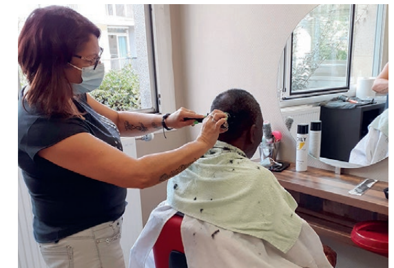
Un moment de détente

Cette prestation est incluse dans le prix de journée.