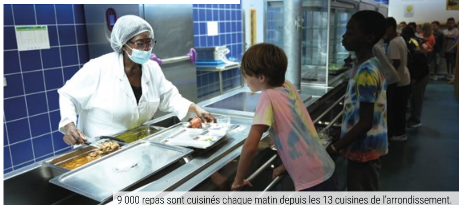
9 000 repas sont cuisinés chaque matin depuis les 13 cuisines de l'arrondissement.

Les repas servis respectent les principes d'équilibre alimentaire et favorisent les produits de saison, représentant plus de 80 % des ingrédients utilisés. Depuis mai 2022, deux menus végétariens sont proposés chaque semaine pour sensibiliser les enfants à leur alimentation, à la cause animale, et à l'impact de la consommation de viande sur la santé, le climat et la biodiversité. À la rentrée 2024, plus de 84 % des produits qui composent les repas sont issus de l'agriculture biologique, labellisée et durable.