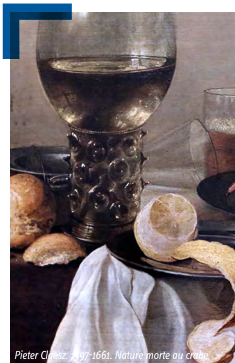
Pieter Claesz. 1597-1661. Nature morte au crabe.