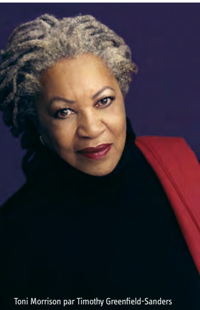
Toni Morrison

Bibliothèque Toni Morrison, 20bis, avenue Parmentier 01 55 28 30 15