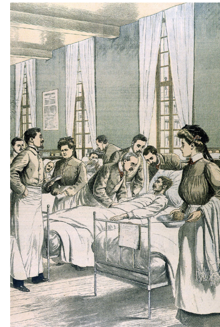
Visite à l'hôpital, nouvelle tenue pour les infirmières, « Le Petit Journal », mai 1903.

«Les midis de l'histoire» organisés à la mairie du 11 e arrondissement poursuivent leur exploration du monde de la santé à Paris. Formation et savoirs médicaux, organisation de la médecine à Paris, professions de santé, politiques sanitaires, liens avec les patients ; autant de thématiques qui seront examinées à la lumière des dernières avancées de l'historiographie.