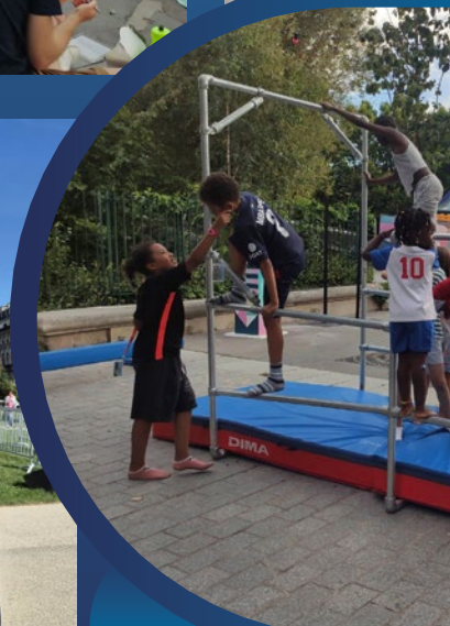
Activités sportives de la zone de festivités