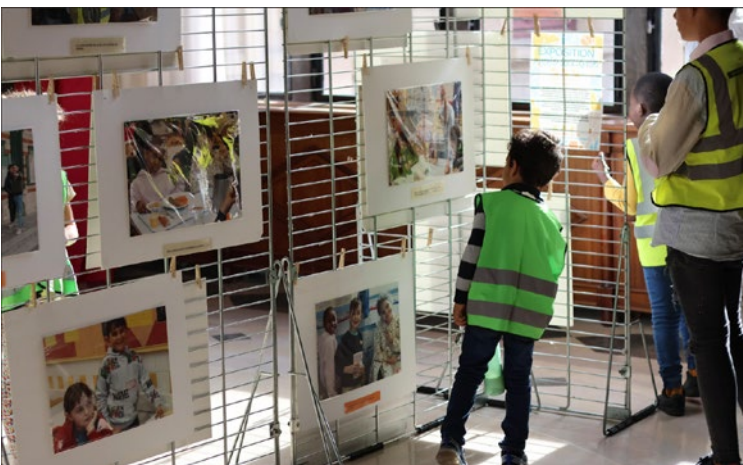
Vernissage des expositions photo réalisées par les enfants de l'Aire d'accueil des gens du voyage du Bois de Vincennes, Mairie du 12 e arrondissement, Octobre 2023

Afin de valoriser ces réussites et engagements, la Mairie du 12 e a accueilli à l'automne dernier deux expositions photo collectives réalisées par les enfants qui retraçaient la construction de leur parcours d'élèves de l'aire à l'école.