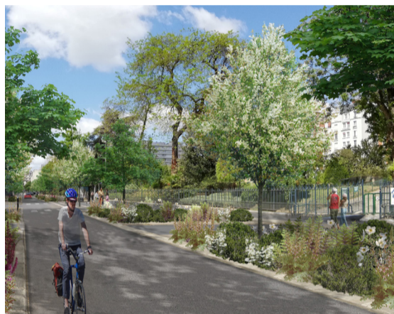
Photomontage après chantier.