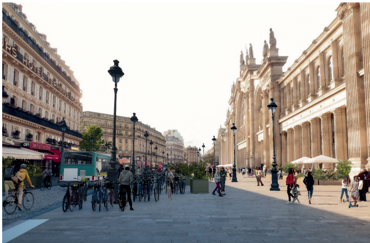
Visuel de la rue de Dunkerque à l'issue de l'aménagement après les Jeux Olympiques et Paralympiques de Paris