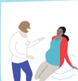
Des conseils aux femmes enceintes