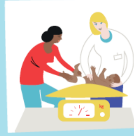
Des conseils et pesées