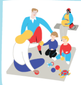
Un lieu d'accueil

Un espace d'accueil et de soins, gratuit pour les enfants de 0 à 6 ans et leurs parents