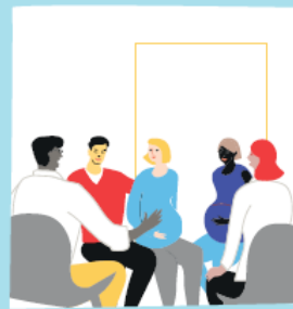
Des groupes de futurs parents