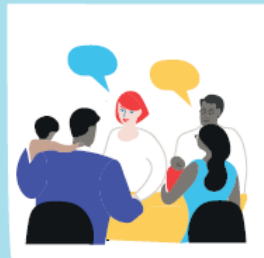
Des entretiens individuels avec interprète selon les besoins