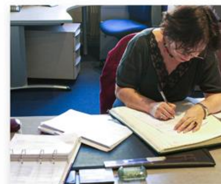
Reprendre une demande en cours de rédaction ou suivre vos demandes