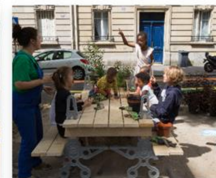
Répondre à un appel à projets ou déposer une demande pour un dispositif spécifique