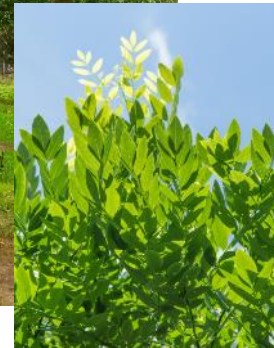
Sophora japonica 20m ht

Choix d'arbres de moyen développement avec une porte colonnaire pour l'alignement sur la rue Boutin.