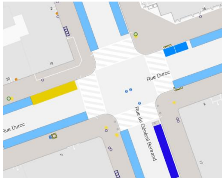
Plan de l'état actuel