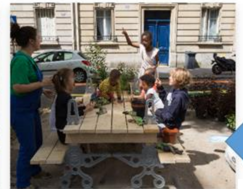
Répondre à un appel à projets ou déposer une demande pour un dispositif spécifique