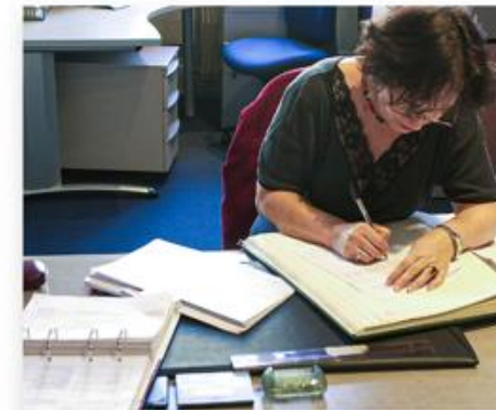
Reprendre une demande en cours de rédaction ou suivre vos demandes

3) La page « dépôt et suivi de demandes de subvention » s'affiche, Cliquez sur « Répondre à un appel à projet ou déposer une demande pour un dispositif particulier