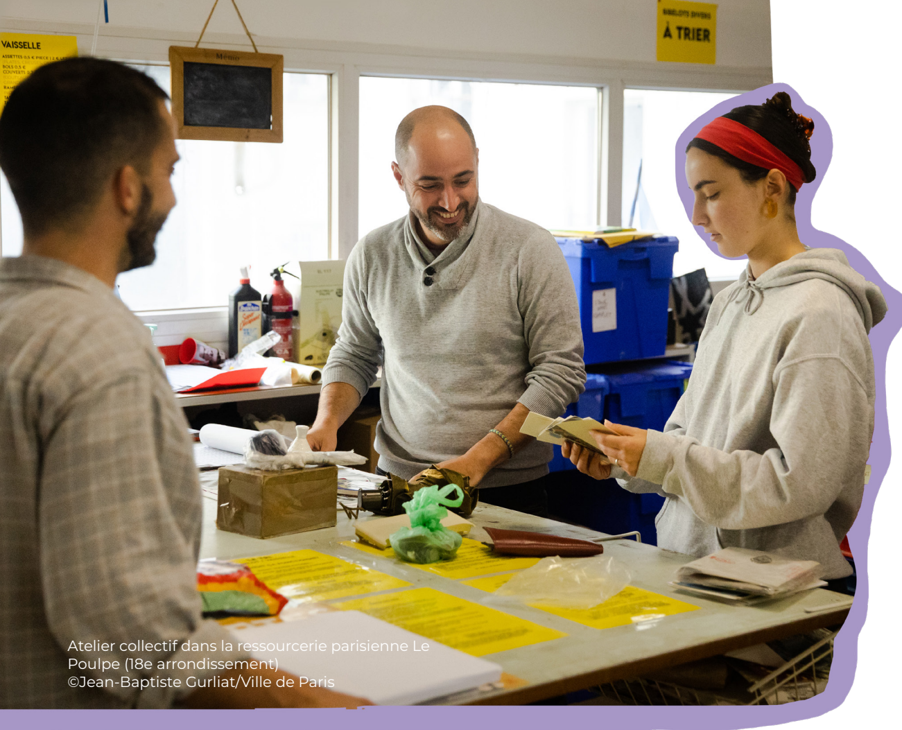
Atelier collectif dans la ressourcerie parisienne Le Poulpe (18e arrondissement)

Avec ce plan inédit, la Ville de Paris compte offrir à l'ensemble des Parisiennes et des Parisiens la possibilité de consommer autrement, en leur proposant une panoplie de solutions nouvelles et économiques émanant de l'économie sociale et solidaire, au plus proche de chez eux. Cela se traduira notamment par le soutien aux lieux de réemploi et la promotion du réflexe réparation, afin de donner une seconde vie aux objets et de lutter contre l'obsolescence programmée.