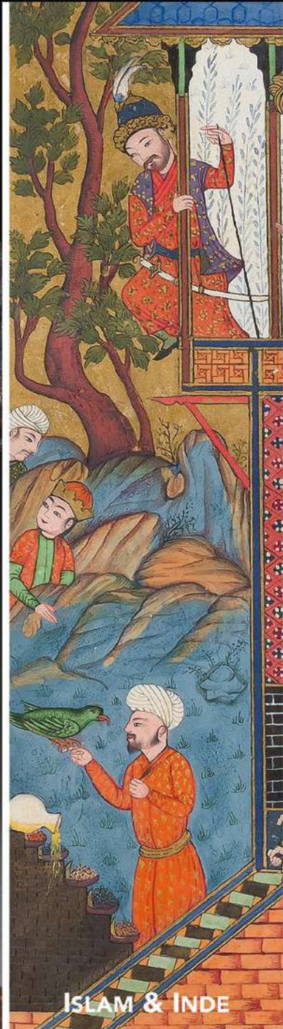
ISLAM & INDE