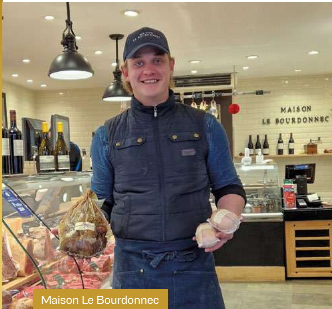
Maison Le Bourdonnec