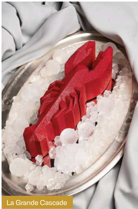
La Grande Cascade