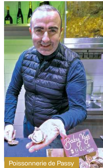
Poissonnerie de Passy