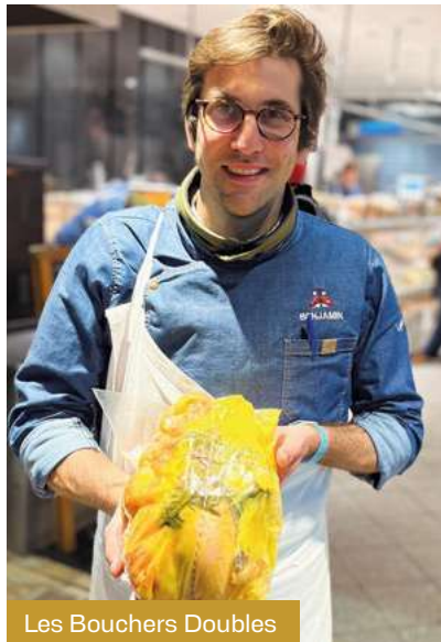
Les Bouchers Doubles