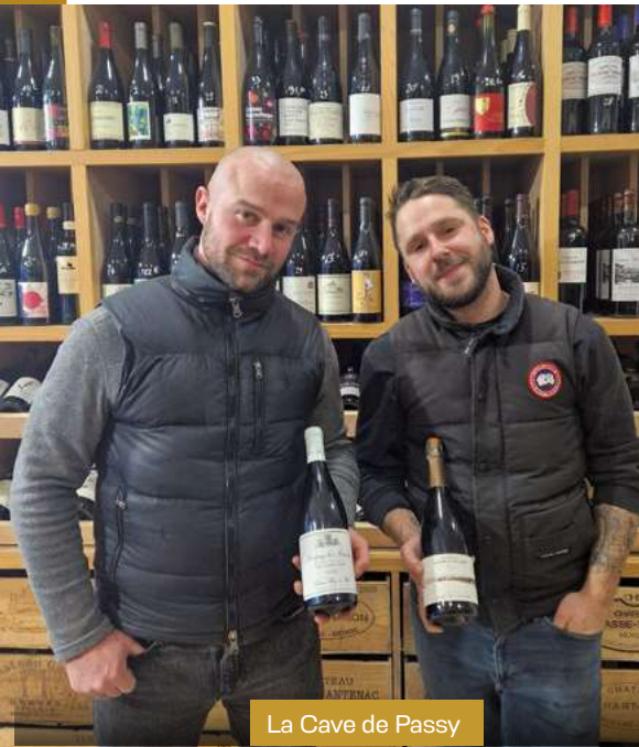
La Cave de Passy