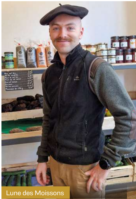
Lune des Moissons