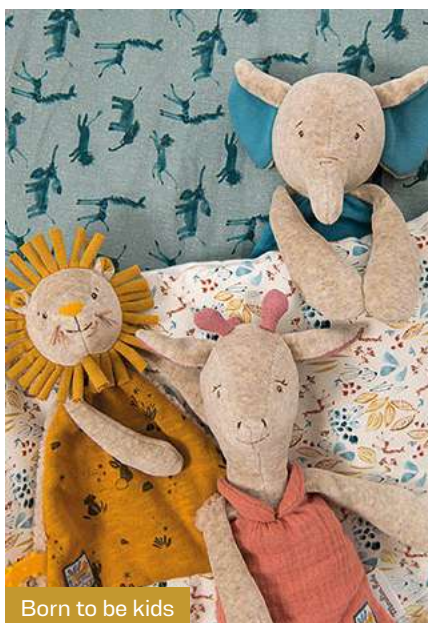
Born to be kids