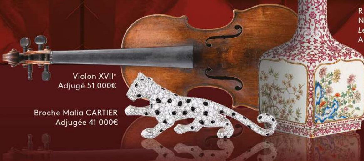
Violon XVII e Adjugé 51 000€