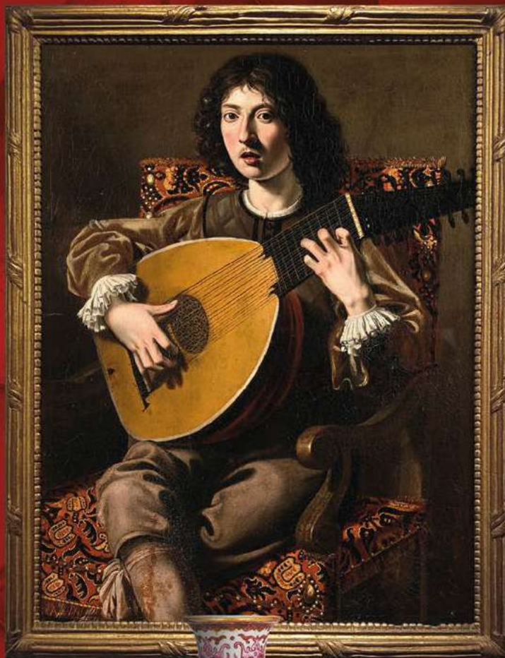
RECORD DU MONDE Nicolas TOURNIER Le joueur de luth Adjugé 330 000€