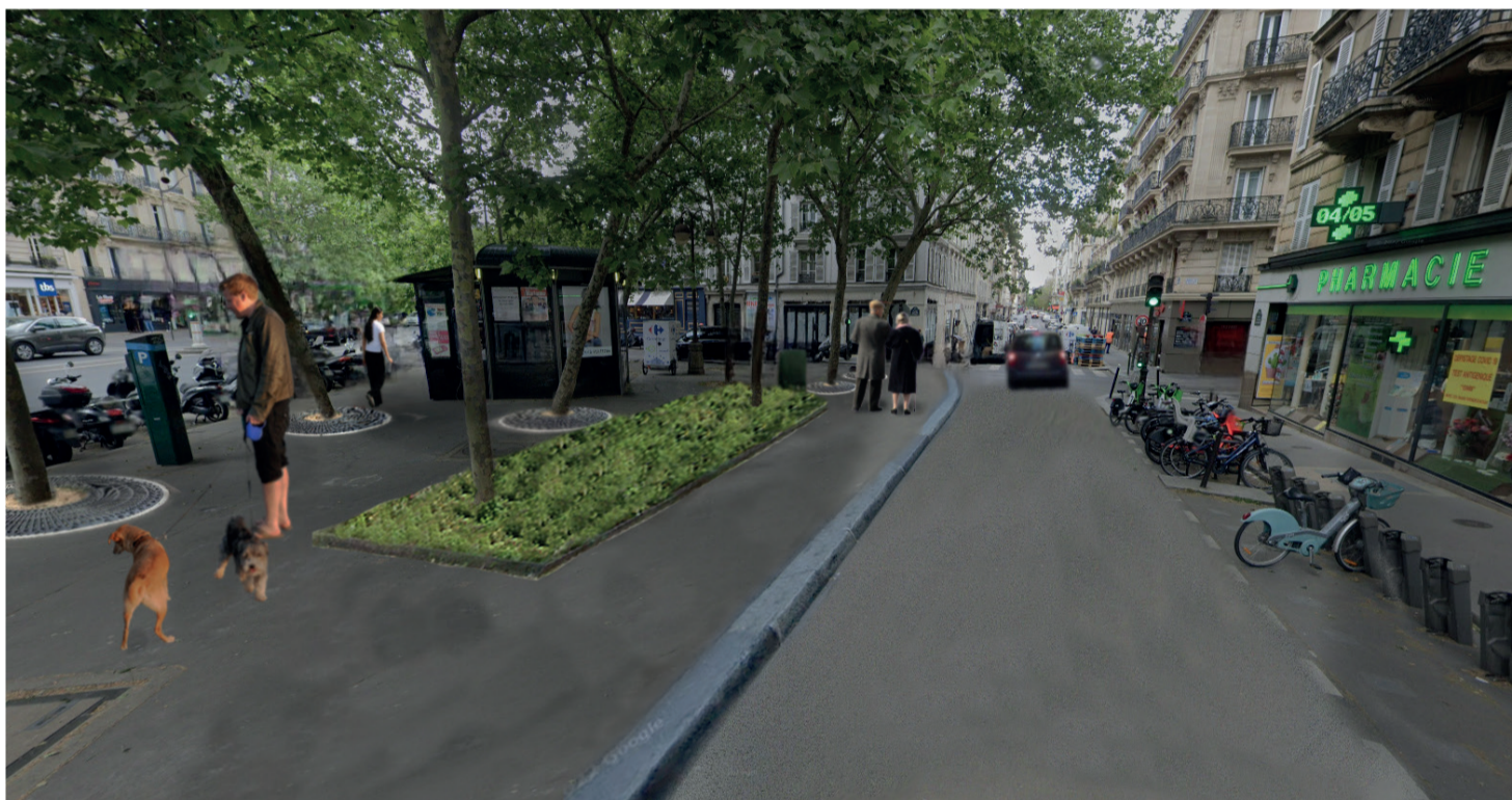
Photomontage du futur aménagement

Dans le cadre de la démarche « Embellir votre quartier » (Ternes Maillot / Courcelles Wagram) vous avez fait part de vos nombreuses idées pour améliorer et rendre plus agréables les espaces de votre quotidien.