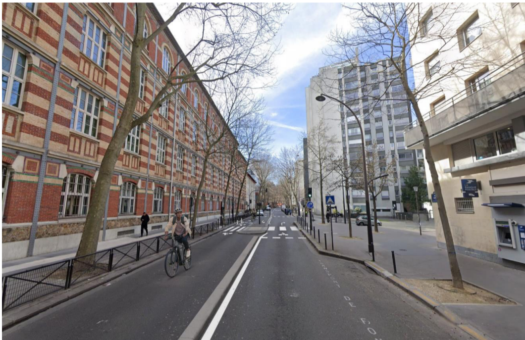
Photomontage du projet

Paris se transforme pour un partage plus équilibré de l'espace public et une meilleure qualité de l'air et de l'environnement. La Ville de Paris réalise les travaux d'apaisement de la rue Manin.