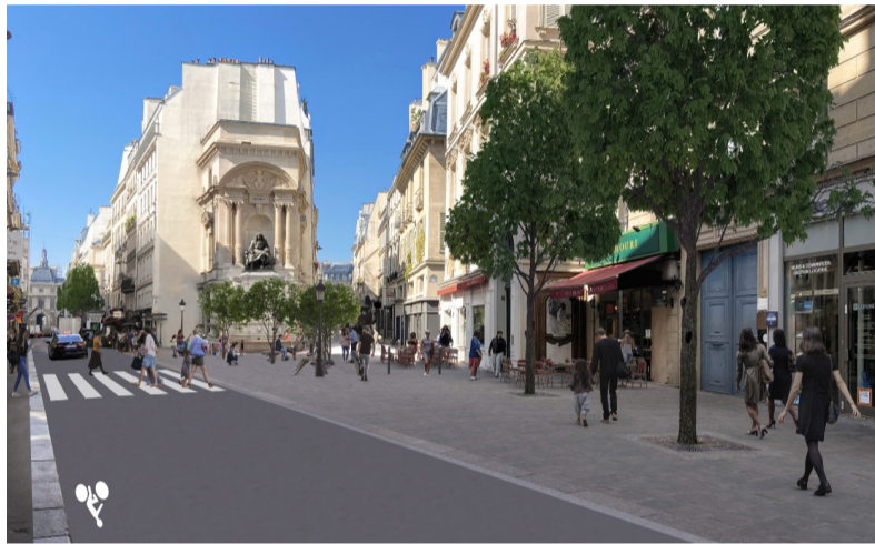
Place Mireille - Photomontage du projet à terme