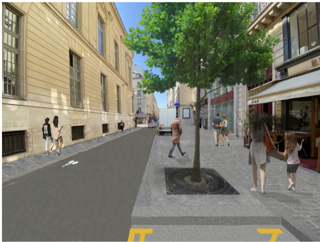
Rue de Richelieu - Photomontage du projet à terme crédits LUXIGON et AEAT

Une nouvelle lettre d'information sera diffusée pour les phases suivantes.