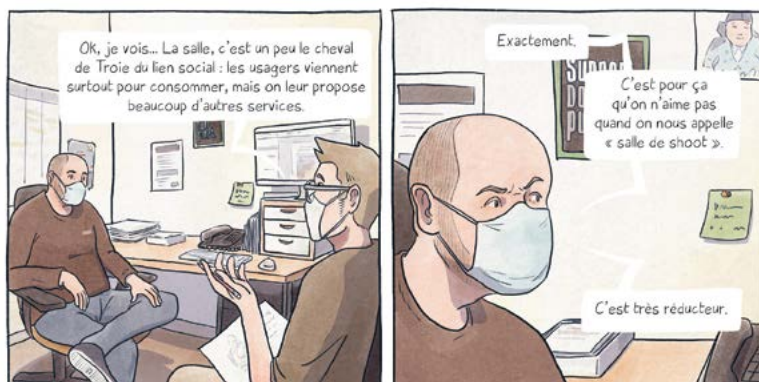
Extrait de la bande dessinée À moindres risques, de Mat Let (août 2024, éditions La Boîte à Bulles, 22 €).