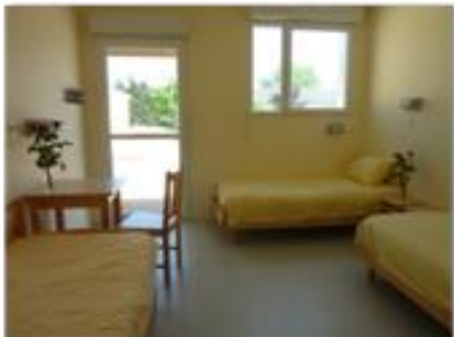
Chambre de 3