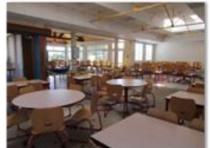
Salle de restaurant