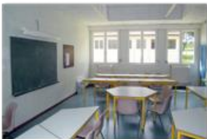
Salle d'activités- réunion