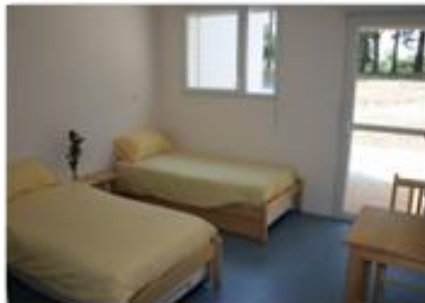
Chambre de 2