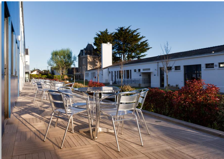
La nouvelle terrasse face aux chambres

Le centre est confortable (l'isolation est performante) et convivial (terrasse aménagée, parc paysager, salle café, baby foot...)