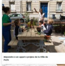
Répondre à un appel à projets de la Ville de Paris