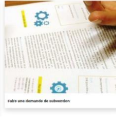
Faire une demande de subvention