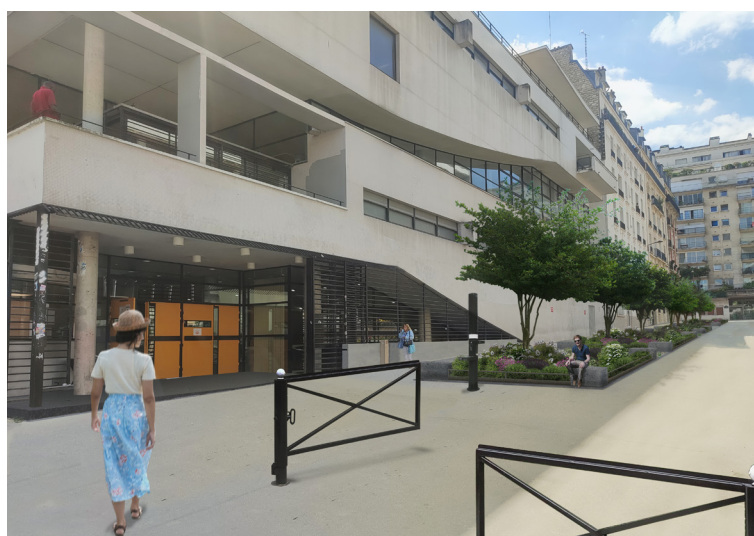
Photomontage de la Rue Saint-Hippolyte

Enfin - pour de grands enfants ! - la rue Saint-Hippolyte, qui accueille le campus Port-Royal-centre René Cassin est profondément transformée. Fermeture de la rue, plantation de près de dix arbres, création de bandes plantées, ajout de mobilier urbain adapté à l'Université sont au programme de cet aménagement.