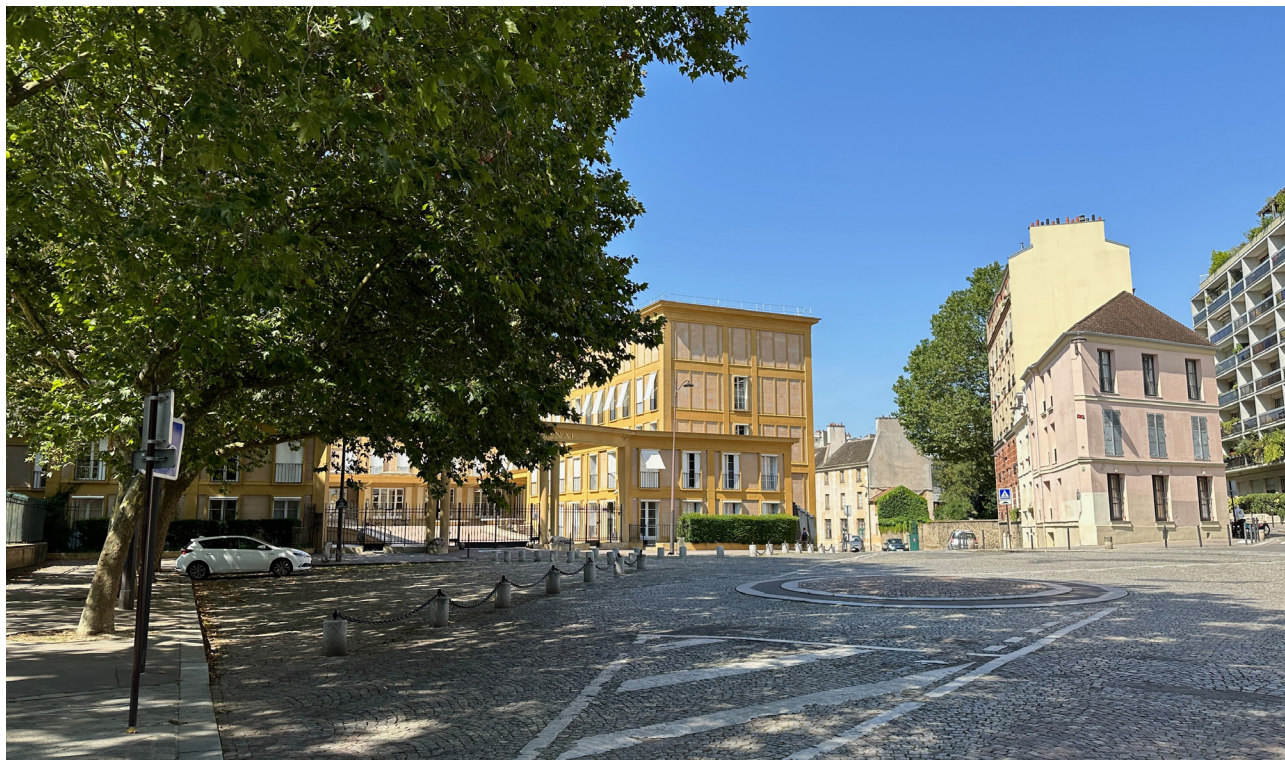
Place en hommage aux femmes victimes de violences

“ VOTRE PROJET AMBITIEUX POUR EMBELLIR VOTRE QUARTIER ET GAGNER EN QUALITÉ DE VIE. ”