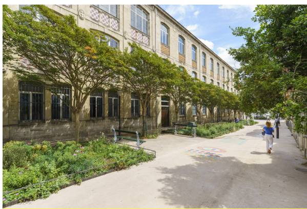
Rue Damesme

Au-delà des plantations d'arbres, de larges jardinières composées de vivaces et d'arbustes seront également créées dans de nombreuses rues pour renforcer davantage la présence du végétal et favoriser la biodiversité.