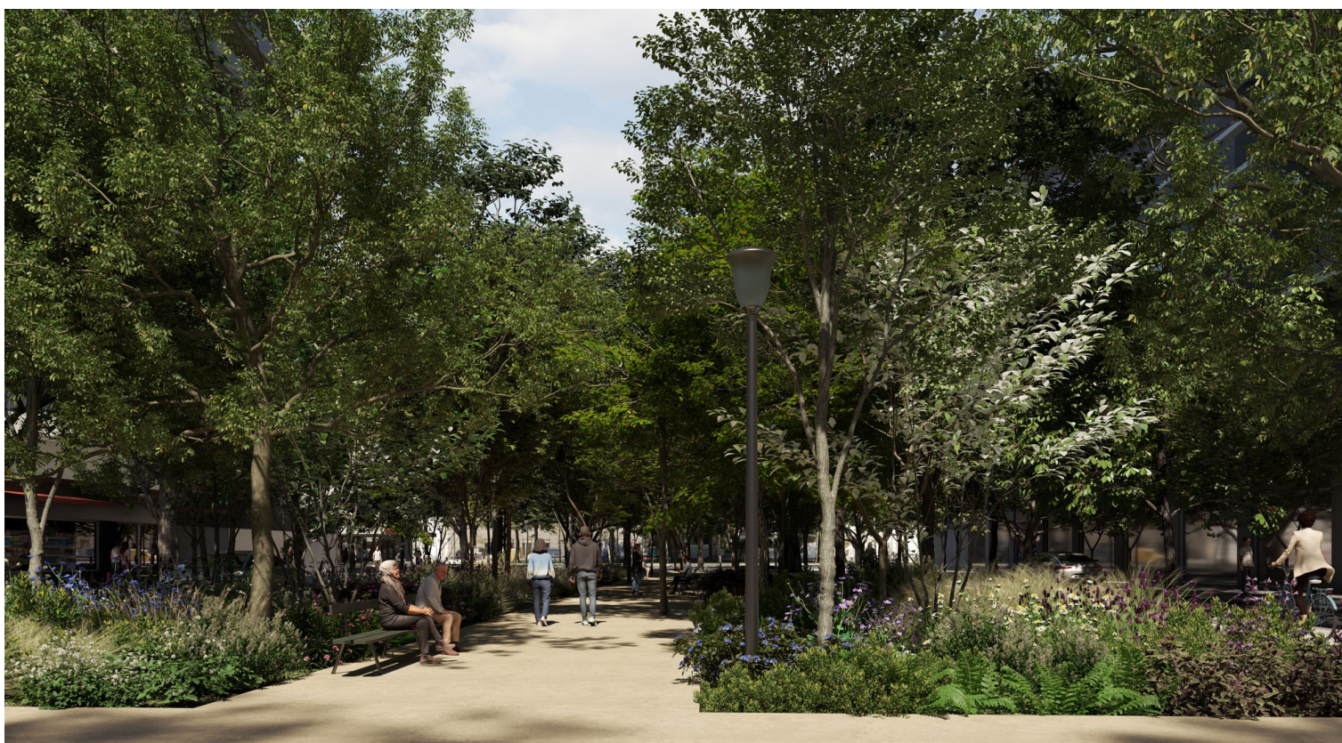
Photomontage du projet