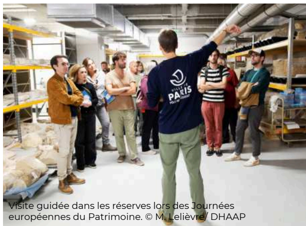
Visite guidée dans les réserves lors des Journées européennes du Patrimoine.

Les visites guidées proposées dans les réserves du Pôle archéologique de Paris ont rassemblé plus de 200 visiteurs en 2024, notamment à l'occasion des Journées européennes de l'archéologie (juin) et des Journées européennes du Patrimoine (septembre). Les réserves ont également bénéficié de la création de supports de médiation (panneaux, cartels) avec le soutien de la Direction des Affaires culturelles de la Ville de Paris.