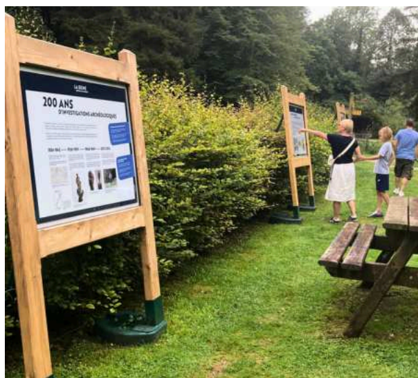
Exposition sur l'histoire des sources de la Seine.

Le Pôle archéologie a conçu 5 panneaux à destination du site des sources de la Seine (Côte-d'Or). Destinée à présenter l'histoire de cette enclave parisienne , dont les origines remontent à l'Antiquité, l'exposition a été inaugurée lors du passage de la flamme olympique, le 12 juillet dernier.