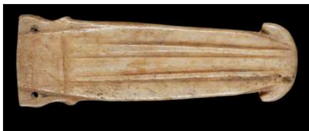
Fourreau d'épée miniature gallo-romain, en os, découvert à Meaux à l'occasion d'une fouille réalisée par l'Inrap.