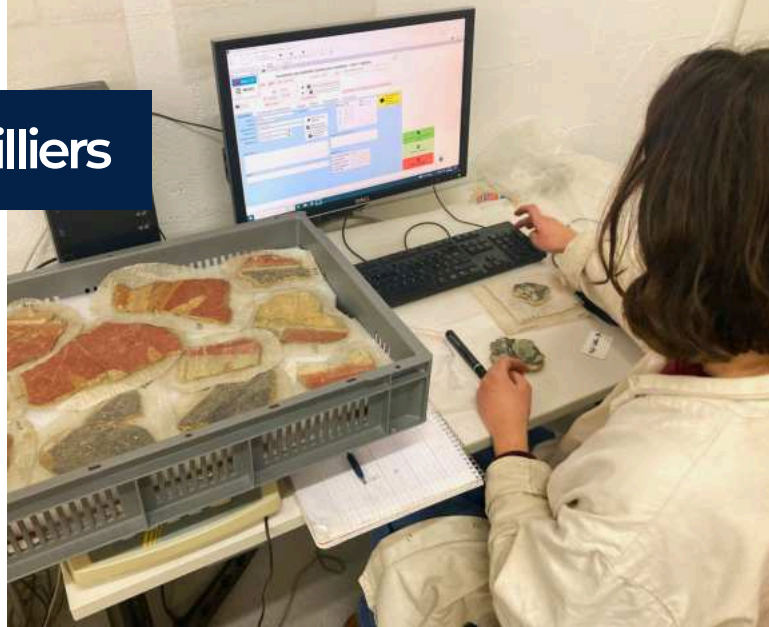
Enregistrement de fragments d'enduits peints antiques dans la base de données.

Ce travail colossal a entraîné la création d'un nouveau système d'inventaire. Au total, près de 100 000 objets (isolés ou en lots) ont été enregistrés au sein de la base de données dédiée à la gestion des collections du Pôle archéologique.