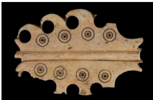
Si la majorité des pièces étudiées ont pu être identifiées (épingles, jetons, fourreaux d'épées) la fonction de cet objet antique demeure une énigme.