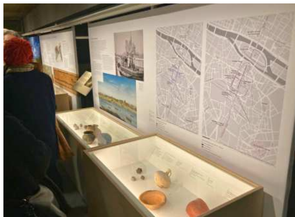
Exposition « Dans la Seine ».

Un pieux en bois médiéval, mis au jour sur l'île de la Cité, à quant à lui rejoint la crypte archéologique de Paris pour son exposition « Dans la Seine ». Le Pôle archéologique a, par ailleurs, assuré le suivi sanitaire de l'ensemble du mobilier présenté dans les vitrines.