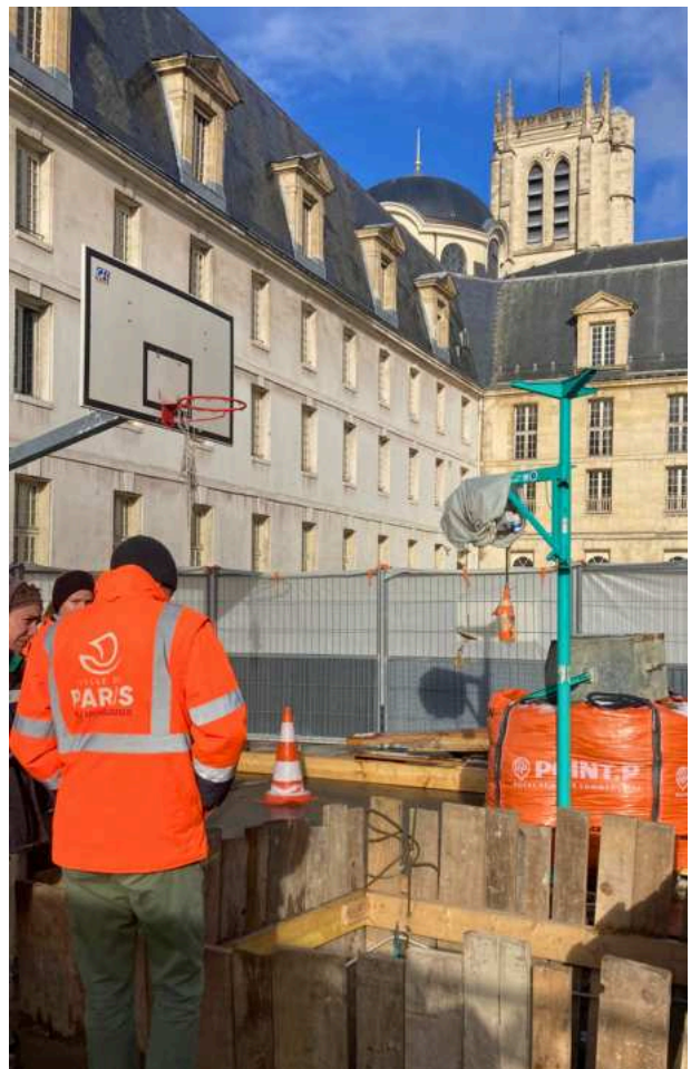
Sondage dans la cour du Lycée Henri IV.