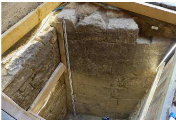
Vestiges du donjon médiéval du Palais de Justice.