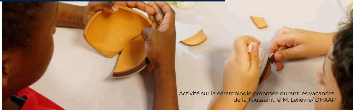
Activité sur la céramologie proposée durant les vacances de la Toussaint.

Depuis le lancement du projet de médiation « hors les murs » en septembre 2024, plus de 400 élèves de CE2, CM1 et CM2 ont pris part aux ateliers proposés dans 16 écoles élémentaires des 8e, 10e, 12e, 13e, 15e, 17e, 18e et 19e arrondissements.