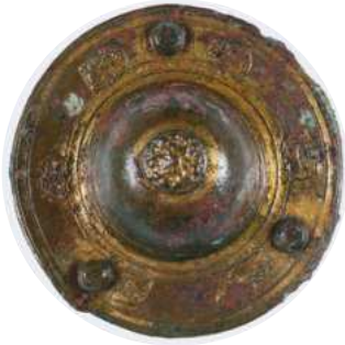
Bossette de mors à cheval (XVIe s.) découverte rue des Blancs-Manteaux.