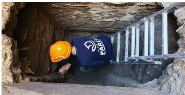
Fouille d'un conduit d'égout dans la cour des Hommes du Palais de Justice.