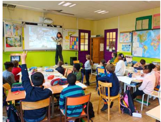
Atelier de médiation sur Lutèce, proposé dans une école parisienne.

Au cours des vacances de la Toussaint, l'équipe de médiation s'est également déplacée dans 6 centres de loisirs du 18e arrondissement pour proposer des activités ludiques sur l'archéologie funéraire et la céramologie.