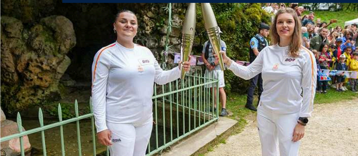
Relais de la flamme devant la grotte artificielle de Source-Seine (Côte-d'Or).