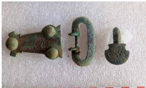
Plaque boucle mérovingienne mise au jour à Noisy-le-Grand (93) par l'association l'Archéologie des nécropoles (ADN).

Cette collaboration se poursuit dans le laboratoire de restauration, où de nombreuses pièces de mobilier issus de fouilles franciliennes sont pris en charge.