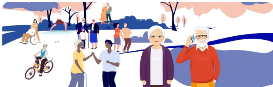
LA SOUS-DIRECTION DE L'AUTONOMIE (SDA)

Organisée en 5 sous-directions et regroupant près de 9 000 agents, la DSol accompagne les Parisiens en difficulté, soutient les personnes âgées et en situation de handicap, lutte contre les exclusions et assure la protection de l'enfance, avec des établissements et professionnels basés à Paris, mais aussi en banlieue et en province.