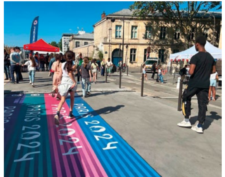
Animations place Jan Karski