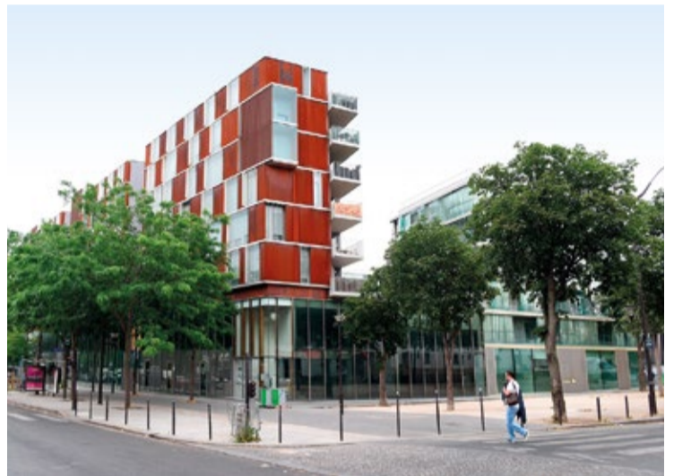
Des aménagements secteur Binet

Nous sommes à vos côtés pour faire avancer tous ces projets.