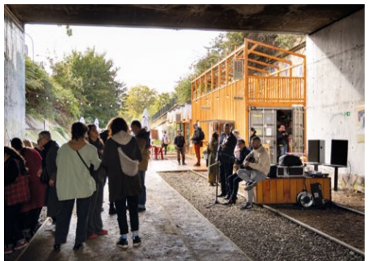
Le jardin des Traverses