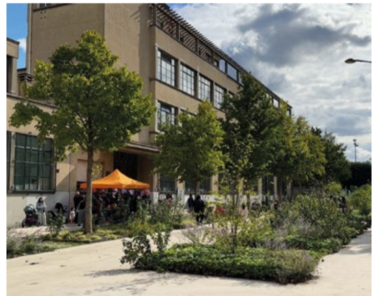
La « rue aux écoles » Émile Levassor