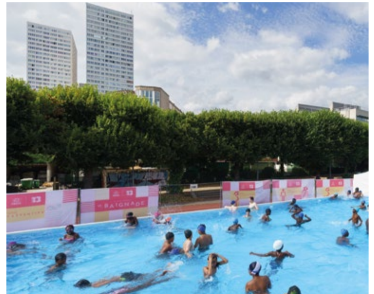
Baignade estivale au centre sportif Georges Carpentier