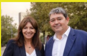
Anne HIDALGO Maire de Paris

Nous sommes à vos côtés pour faire avancer tous ces projets.