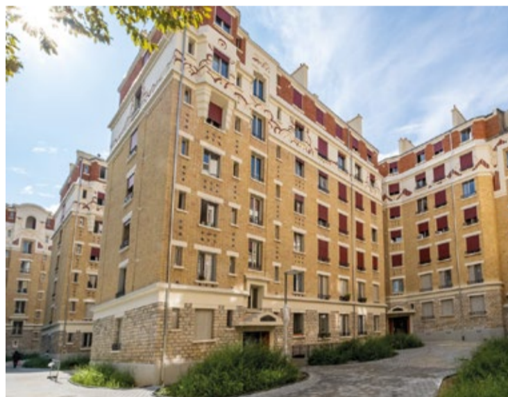
La résidence du Château des Rentiers