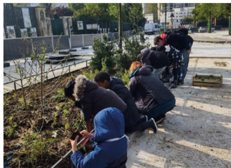
Plantation rue Le Vau