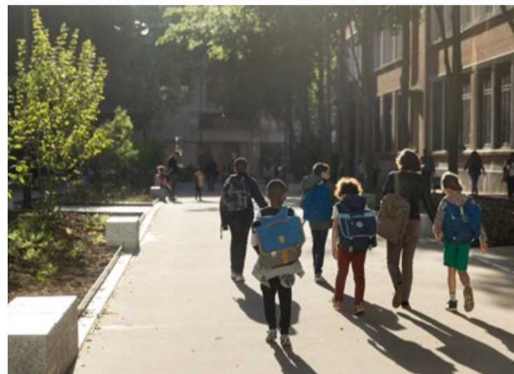
La « rue aux écoles » Pierre Foncin