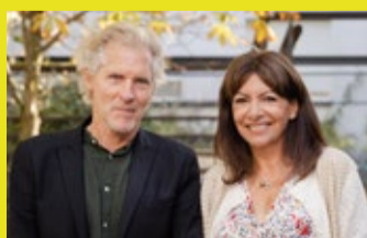
Anne HIDALGO Maire de Paris

Nous sommes à vos côtés pour faire avancer tous ces projets.