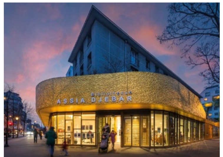
La bibliothèque Assia Djebbar