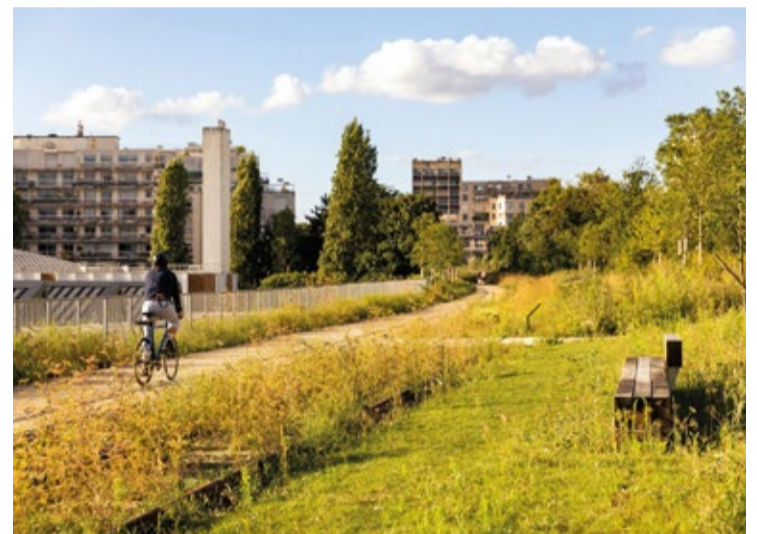
Le Bois de Charonne