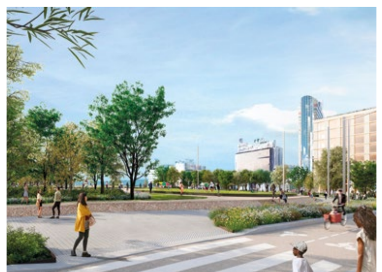
Perspective du réaménagement de la Porte de Montreuil