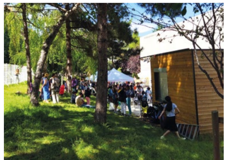
La cabane Ravel