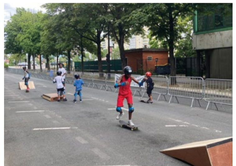
Activités boulevard Carnot