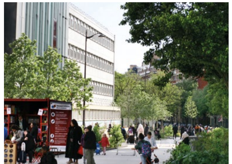
Animations avenue Lamoricière