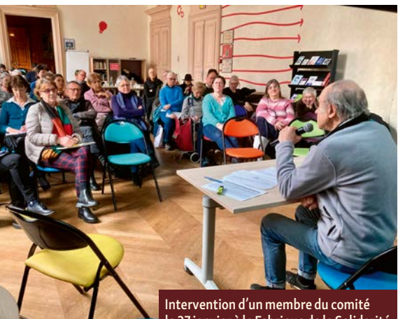
Intervention d'un membre du comité le 27 janvier à la Fabrique de la Solidarité

« Les participants sont très motivés et ces échanges nous permettent de découvrir toutes les initiatives mises en place par la Ville pour améliorer la qualité de vie des seniors. », souligne un autre membre du comité. Grâce à cet espace d'expression, la Ville de Paris renforce son engagement en faveur d'un cadre de vie plus sûr, accessible et bienveillant pour les seniors.