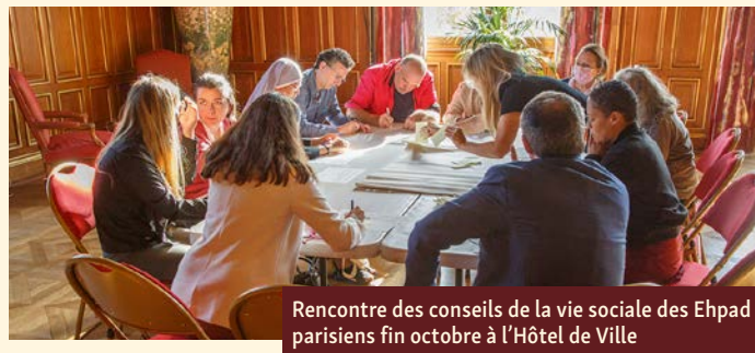
Rencontre des conseils de la vie sociale des Ehpad parisiens fin octobre à l'Hôtel de Ville